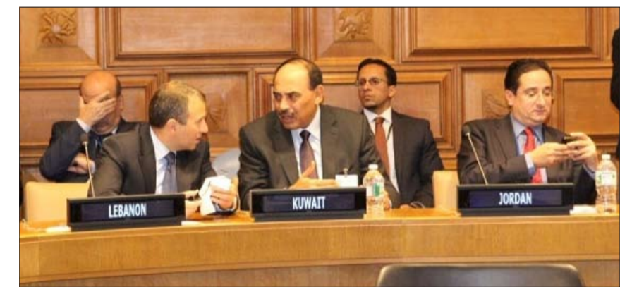
الشيخ صباح الخالد خلال الاجتماع الوزاري بشأن الاستجابة الدولية اللازمة الإنسانية في سورية والدول المجاورة

المشاريع التي تحتاج إلى اهتمام فوري. ولفت الى ان الصندوق الكويتي خصص 23 مليون دولار لتمويل تلك المشاريع وكان من المتوقع وضع المساسات الأخيرة على مذكرة تفاهم لهذه المنحة في المستقبل القريب. وشدد النائب الأول لرئيس مجلس الوزراء ووزير الخارجية الشيخ صباح الخالد الحمد الصباح على ان لبنان يعاني أيضا من تدفق اللاجئين السوريين، موضعا ان الصندوق الكويتي والحكومة اللبنانية وضعا خطة من شأنها أن تغطي جميع المحافظات الثمانية التي تستضيف أعدادا كبيرة من اللاجئين. وقال ان الصندوق الكويتي سيبتزع للبنان بمبلغ 26 مليون دولار لمشاريع في قطاعات حيوية مثل الصحة والتعليم والمياه والصرف الصحي وإدارة النفايات.