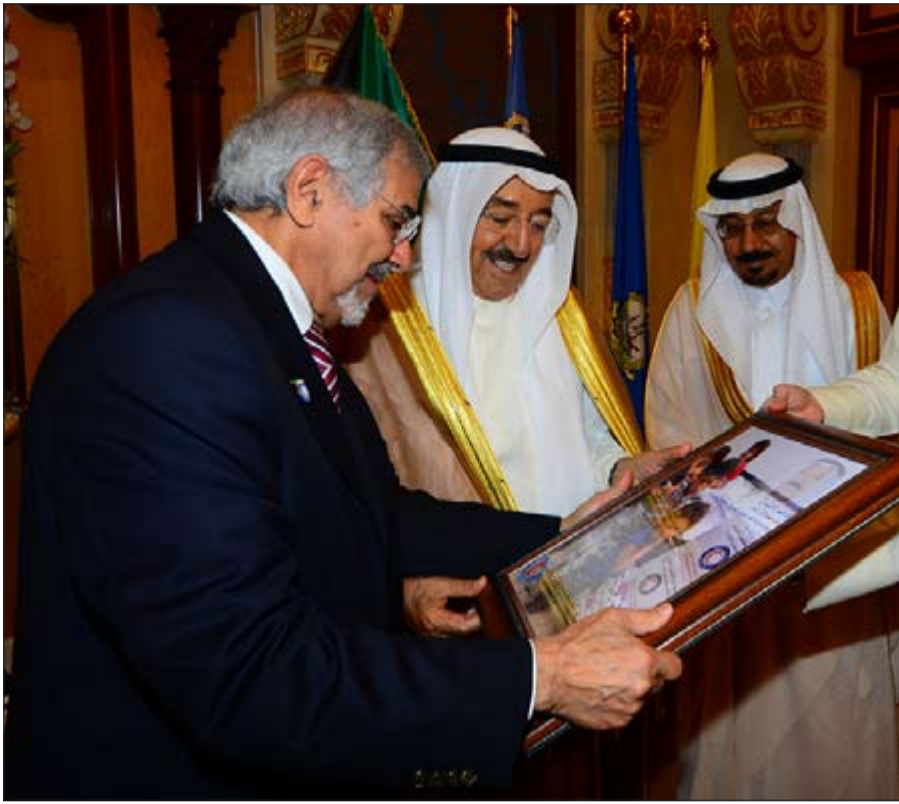
صاحب السمو الأمير يتسلم قلادة أبي بكر الصديق من الطبقة الأولى من د.عبدالله بن محمد الهزاع

وبعث سمو ولي العهد الشيخ نواف الأحمد بترقية تهنئة الى الرئيس جوسيه ماريو فاز رئيس جمهورية غينيا بيساو الصديقة، ضمنها سموه خالص تهانئه بمناسبة العيد الوطني لبلاده، متمنيا له موفور الصحة والعافية. كما بعث سمو رئيس مجلس الوزراء الشيخ جابر المبارك بترقية تهنئة مماثلة.