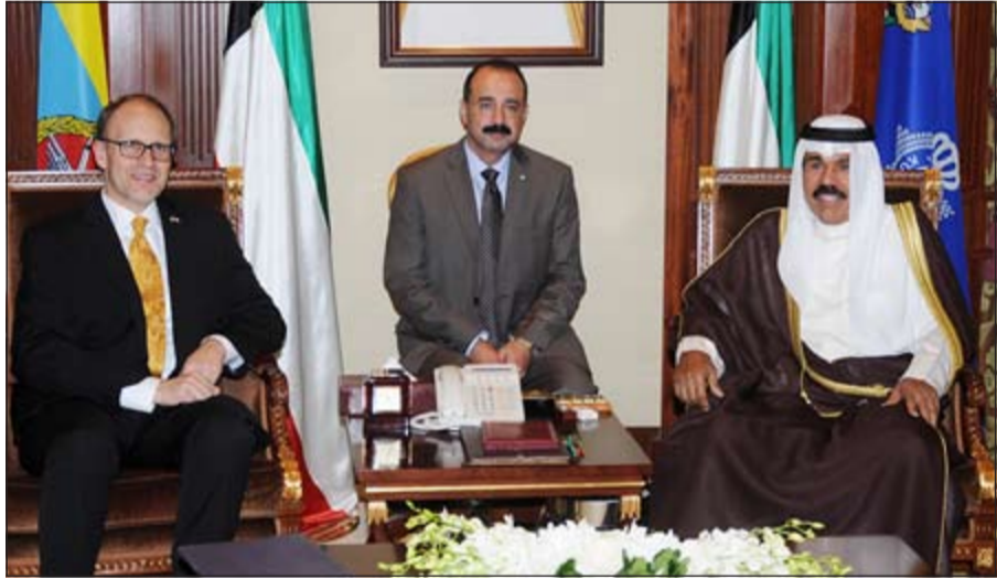
سمو ولي العهد مستقبلا السفير الأميركي دوجلاس سيليمان

واستقبل سموه سفير المملكة المتحدة لبريطانيا العظمى وشمال أيرلندا لدى الكويت ماثيو لودج وذلك بمناسبة توليه مهام منصبه الجديد سفيرا لبلاده. كما استقبل سمو ولي العهد الشيخ نواف الأحمد بقصر بيان ظهر امس سفير الولايات المتحدة لدى الكويت لويس سلمان الحمدود، كما استقبل سمو ولي العهد الشيخ نواف الأحمد سفير الولايات المتحدة الأمريكية لدى الكويت دوجلاس سيليمان وذلك بمناسبة توليه مهام منصبه الجديد سفيرا لبلاده.