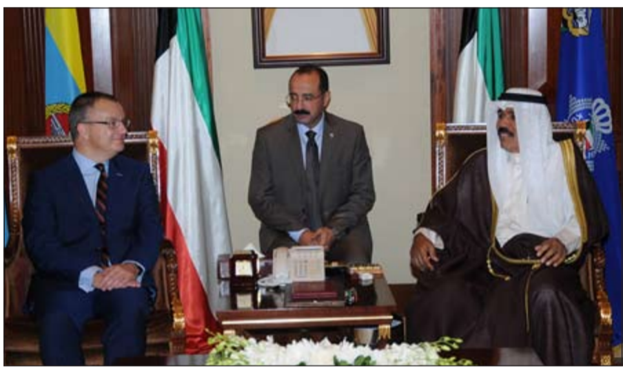
سمو ولي العهد الشيخ نواف الأحمد مستقبلا السفير البريطاني ماثيو لودج

الهزاع: أعمال الإغاثة الإنسانية منتشرة في كل أنحاء العالم