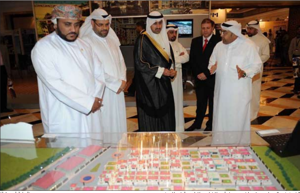
الشيخ نمر الصباح يستمع لشرح حول أحد المشاريع المطروحة في المعرض (إسماء أبو عبيدة)