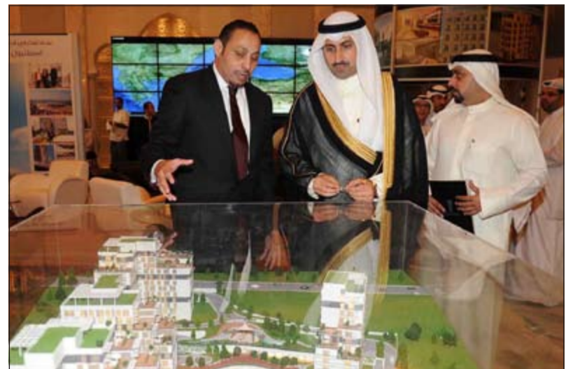
الشيخ نمر الصباح يطلع على مجسم لأحد المشاريع المشاركة في المعرض

العربية والأجنبية مما فسح المجال أمام تنوع الخيارات والاستثمارات وبالتالي تحقيق المزيد من المبيعات والصفقات في دول متعددة. وأشار الصغار إلى أن معرض العقارات الكويتية والدولية يقدم فرصاً حقيقية لمن يرغب في الاستثمار في كل من السعودية وتركيا ومصر، وأن هناك مشاريع كثيرة تليق بطموح المستثمرين الراغبين في الاستثمار العقاري المتميز. وذكر أن المعارض العقارية في الكويت بمنزلة بوابات للمستثمر الكويتي يتعرف من خلالها على مختلف أسواق المنطقة ليحدد خياراته الاستثمارية بشكل أكثر دقة ويقتنص الفرصة المناسبة بشكل سريع.