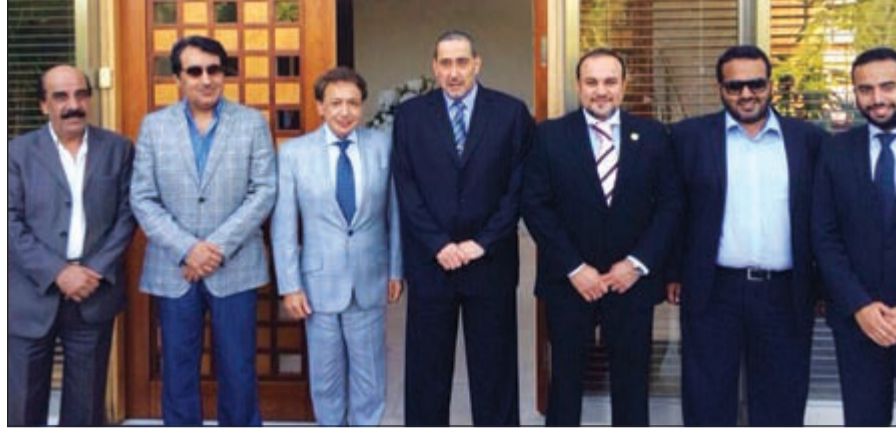
الشيخ فيصل الحمود والسفير رائد الرفاعي يتوسطان أركان السفارة

تعزيز التعاون بين البلدين الصديقين. من جهته، شكر الشيخ فيصل الحمود أعضاء السفارة على حسن الترحيب والحفاوة والاستقبال، مشيداً بعملهم وجهودهم الدبلوماسية المتميزة.