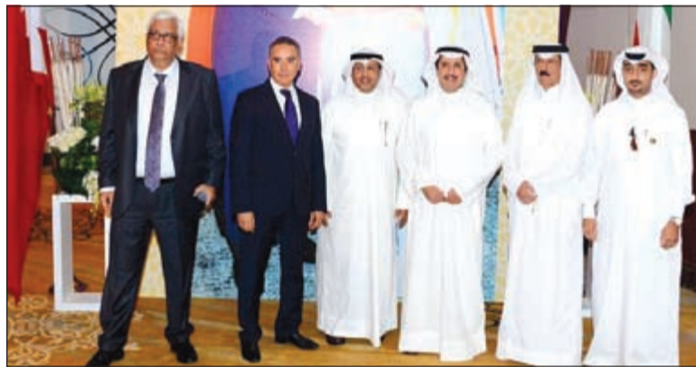
السفير عزام الصباح متوسطا بعض الحضور خلال الحفل

هذا المسمى قدم دول مجلس التعاون كقاعدة للعمل الخيري والإنساني في المنطقة ككل، لاسيما في هذا الوقت الذي تمر به من ظروف صعبة يمتحن فيها الإنسان». وأضاف أن «هذا اللقب هو محط فخر لنا جميعاً سواء في الكويت أو على مستوى دول مجلس التعاون التي جبل أهلها على فعل الخير». حضر الحفل عدد من سفراء دول مجلس التعاون والعرب إضافة إلى حضور العديد من الشخصيات البحرينية العاملة في مجال العمل الخيري والإنساني إضافة إلى عدد من الشخصيات الكويتية.