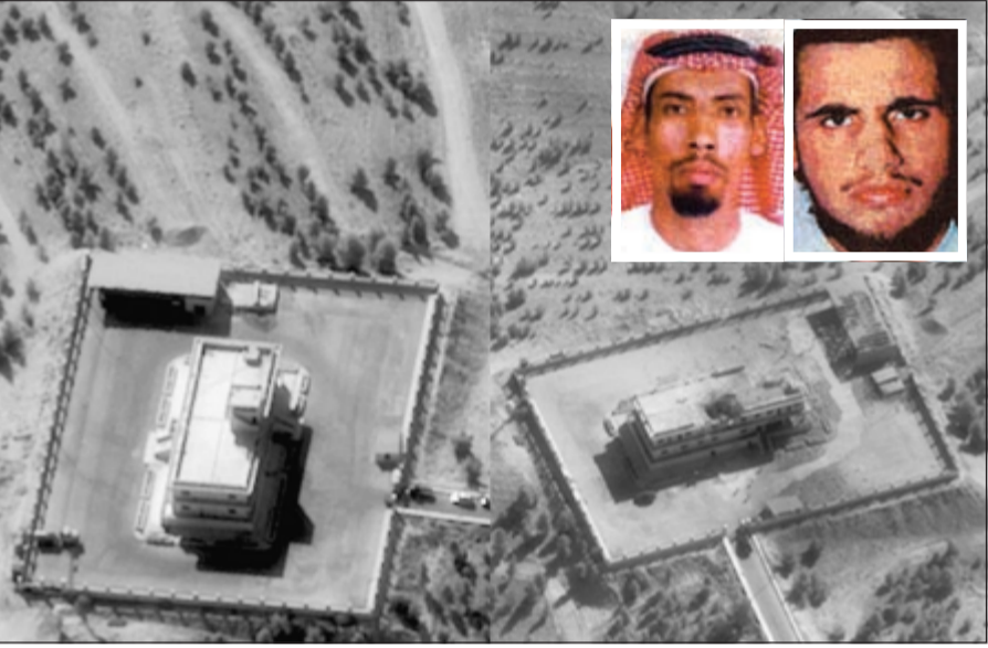
صورة وزعتها «البناتاغون» لمقر قيادة «داعش» في سورية قبل وبعد قصفه بغارة أميركية.. وفي الإطار صورتان لمحسن الفضلي (رويتزر)