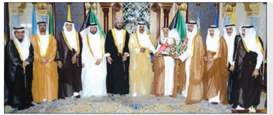
صاحب السمو الامير خلال استقباله رؤساء وفود اجتماع أجهزة الخدمة المدنية والاجتماع التحضيري للجنة الوكلاء