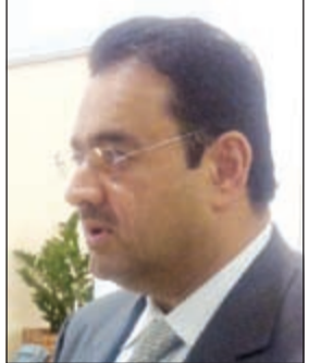
السفير صادق معرفي

قينا- كونا: قال سفيرنا لدى النمسا وممثلنا الدائم لدى المنظمات الدولية في قيبنا صادق معرفي أن المجموعة العربية ستقدم مشروع قرار حول القدرات النووية الإسرائيلية لطرحة رسمياً خلال الدورة الـ 58 للمؤتمر العام للوكالة الدولية للطاقة الذرية التي انطلقت امس. وقال معرفي في تصريح لـ «كونا» على هامش أعمال الدورة ان بند القدرات النووية الاسرائيلية لا يقل اهمية عن أي موضوع مطروح على جسدول أعمال المؤتمر العام لعلاقته المباشرة بتحقيق الأمن والسلم في منطقة الشرق الأوسط.