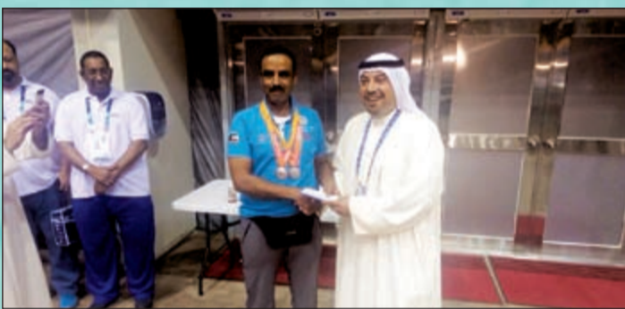
رئيس البعثة الكويتية الشيخ د. طلال الفهد يكرم الرامي فهد الديحاني عقب انجازه

بعد أن حل في المركز الثاني بتحقيق 354 إصابة خلف نظيره الصيني