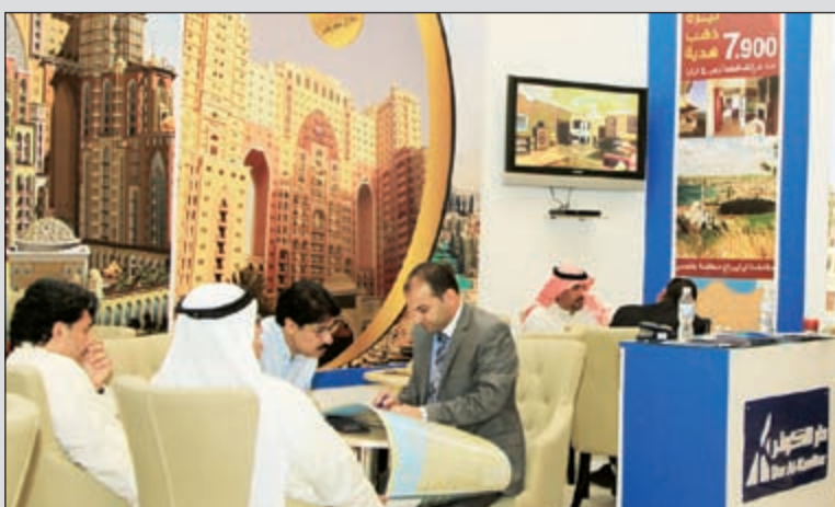
إقبال كبير على المشاركة في الدورة السابقة للمعرض