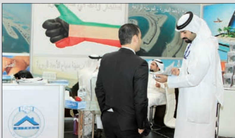
الشركات تطرح مشاريع جديدة في الدورة الجديدة من المعرض