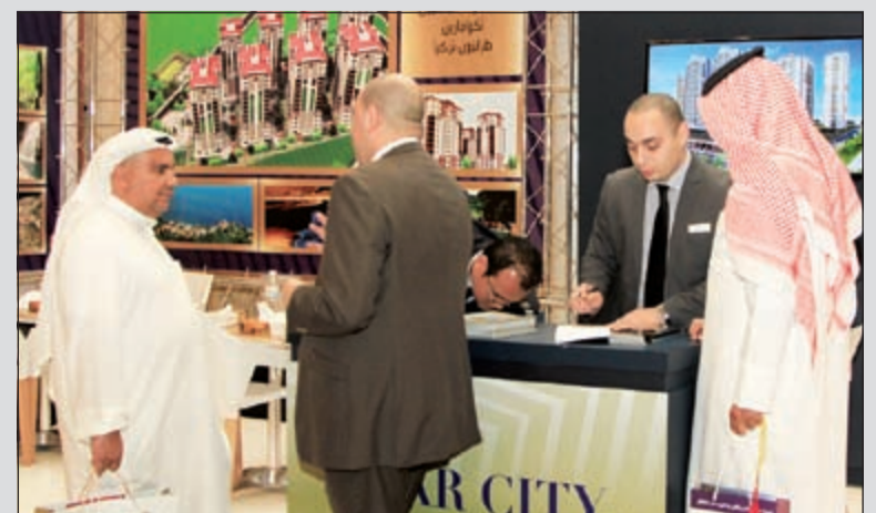
منتجات عقارية وسياحية وصكوك وشاليهات بأسعار مناسبة في انتظار زوار المعرض