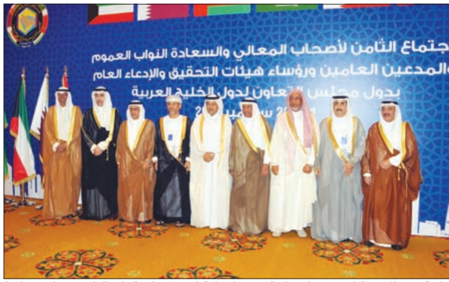
نواب العموم والمدعون العامين ورؤساء هيئات التحقيق والادعاء العام بدول مجلس التعاون الخليجي (محمد ماشم)