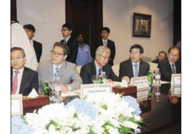
جانب من وفد كوريا الجنوبية يتابع فعاليات توقيع العقد