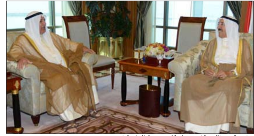
صاحب السمو الأمير الشيخ صباح الأحمد مستقبلاً علي الغانم

سموه خالص تهانيه بمناسبة العيد الوطني لبلاده، متمنياً له موفور الصحة والعافية. كما بعث سمو رئيس مجلس الوزراء الشيخ جابر المبارك ببرقية تهنئة مماثلة. وبعث صاحب السمو الأمير الشيخ صباح الأحمد ببرقية تهنئة إلى ماري لويس كوليرو بريكة رئيسة جمهورية مالطا الصديقة، عبر فيها سموه عن خالص تهانيه بمناسبة العيد الوطني لبلاده، متمنياً له موفور الصحة والعافية وللبلد الصديق دوام التقدم والازدهار. وبعث سمو ولي العهد الشيخ نواف الأحمد ببرقية تهنئة إلى ماري لويس كوليرو بريكة رئيسة جمهورية مالطا الصديقة، عبر فيها سموه عن خالص تهانيه بمناسبة العيد الوطني لبلاده، متمنياً له موفور الصحة والعافية وللبلد الصديق دوام التقدم والازدهار.