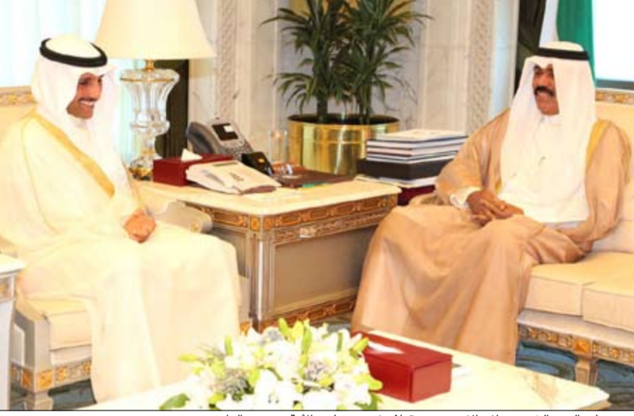
سمو ولي العهد الشيخ نواف الأحمد مستقبلاً رئيس مجلس الأمة مرزوق الغانم

استقبل سمو ولي العهد الشيخ نواف الأحمد في ديوانه بقصر السيف صباح أمس رئيس مجلس الأمة مرزوق الغانم. واستقبل سمو ولي العهد صباح أمس رئيس مجلس الوزراء وزير الداخلية ووزير الشؤون الخارجية بالإتابة الشيخ محمد العبدالله.