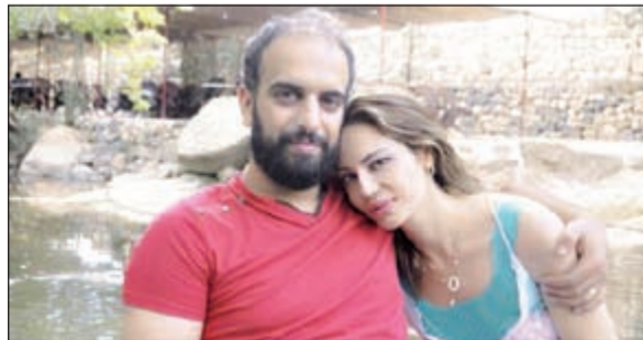
.. في شهر العسل