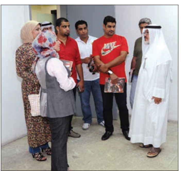
.. في مركز المعلومات