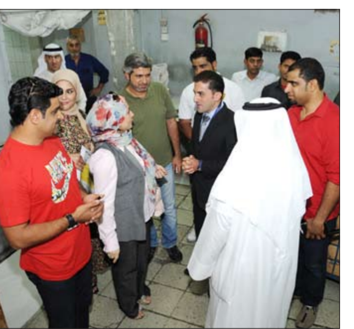
الوفد في جولة مطابع «الأنباء»