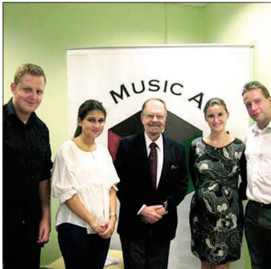
أكاديمية الكويت للموسيقى ترحب وتتمني المواهب الموسيقية