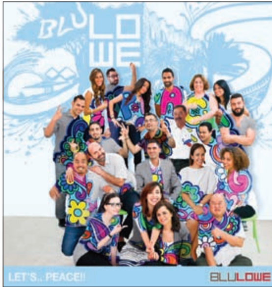
LET'S PEACE! ELLOWE