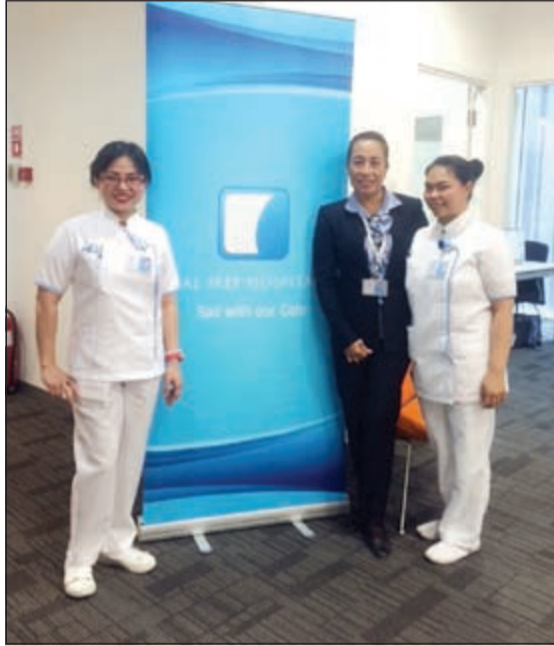
من فريق العمل