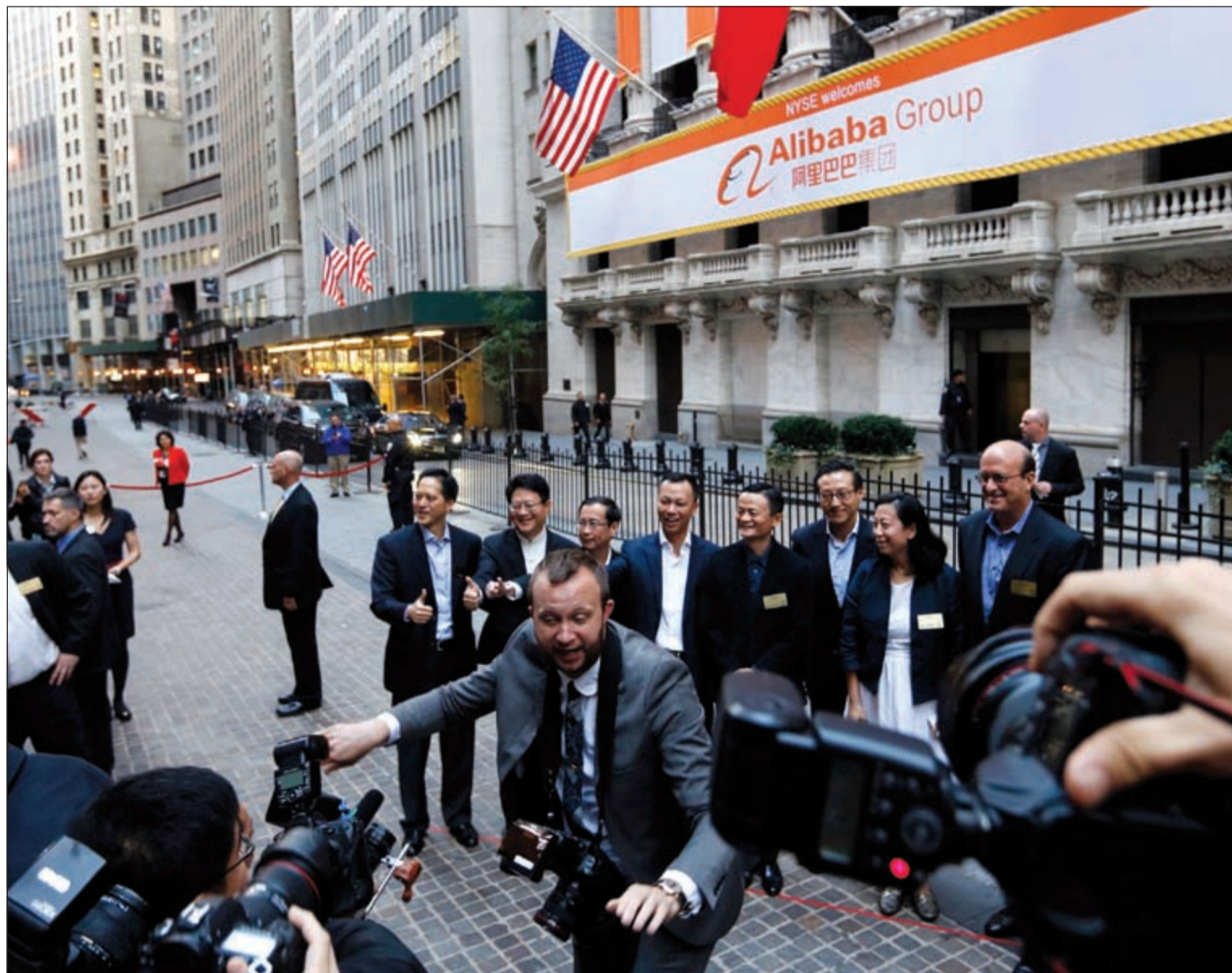
تجمهر عدد كبير من الصحفيين أمس عند وصول المؤسس الصيني لشركة علي بابا «جك ما» لبورصة نيويورك لمراقبة الاكتتاب العام الأولي لشركته «IPO»، تحت شعار «علي بابا في نيويورك» (رويترز)