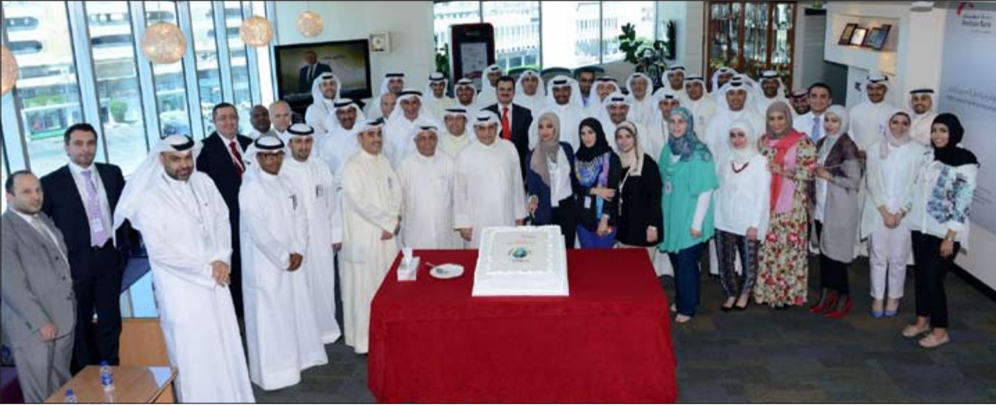
عالم المجد خلال قطع قالب الكيك مع الموظفين

500 بنك حول العالم. واستندت المجلة الشهيرة إلى التطورات التي شهدتها البنوك في السنوات الأخيرة وتحوله من الخسارة إلى الربح في زمن قياسي إلى جانب التغيرات الجذرية التي شهدتها وارتفاع حجم أصوله. وكانت وكالة التصنيف العالمية «فيتش» قد منحت بنك بوبيان تصنيف طويل الأجل «A+» وتصنيف قصير الأجل «F1»، وتصنيف القدرة الذاتية «BB+» وهو من أعلى التصنيفات المحلية من حيث القدرة الذاتية.