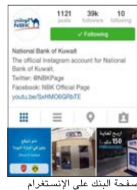
صفحة البنك على الإنستغرام