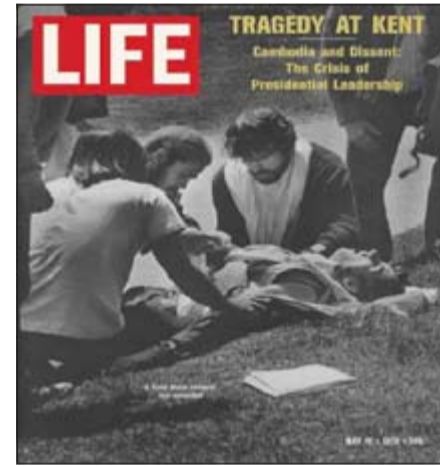
أحداث جامعة كنت كما تصدرت غلاف «لايف» 1970