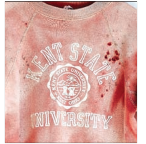
القميص مثار الجدل

واشنطن - أ.ف.ب: اعتذرت ماركة الملابس «أوربن أوتفتر» عن تسويق قميص يبدو ملطخاً بالدماء عليه رمز جامعة كنت سكتايت «ولاية أوهايو شمال الولايات المتحدة» التي شهدت أحداثاً دامية وسحبته من الأسواق. وجاء في بيان صادر عن العلامة التجارية أن «أوربن أوتفتر تقدم اعتذارها عن الأضرار» الناجمة عن بيع هذا القميص بسعر 129 دولاراً، وهي «لم تقصد بتاتا التلميح إلى ما حدث في الجامعة سنة 1970». ففي الرابع من مايو من العام 1970، قتل أربعة طلاب وجرح تسعة آخرون بعدما أطلق الحرس الوطني الرصاص على طلاب كانوا يتظاهرون