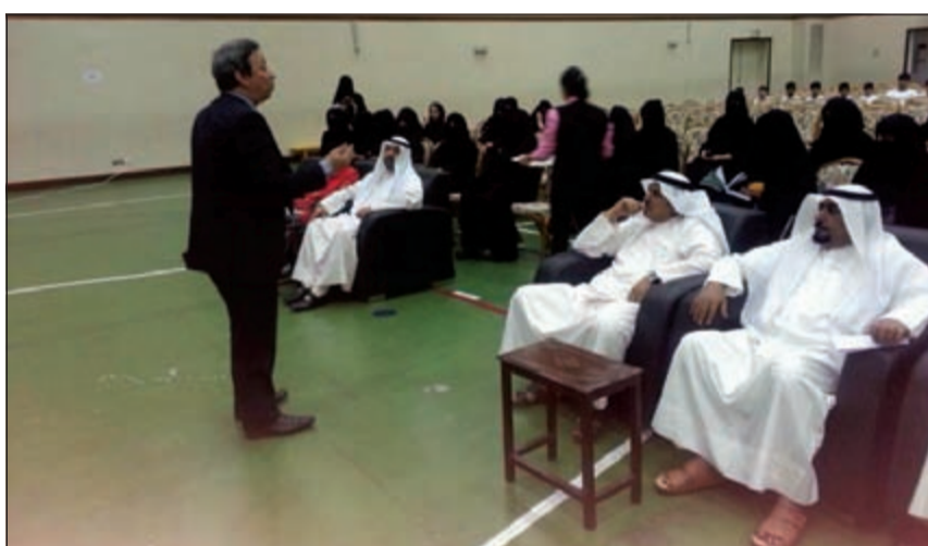
جانب من الندوة التي نظمتها إدارة الصحة الوقائية في مدرسة الوسطى بنات