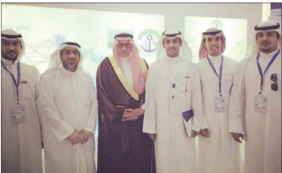
عدد من المهندسين المشاركين مع ممثل راعي المؤتمر

والمنظمات الهندسية المشاركة في المؤتمر. وأوضح النكاس أن ممثلي المهندسين البحرين شاركوا في إقرار ومناقشة توصيات المؤتمر التي تمثلت في إقرار عقد هذا المؤتمر بشكل دوري (كل عامين)، والعمل على تكثيف برنامج التأهيل والتدريب لرفع كفاءة العاملين في الشركات العاملة في مجال المنصات البحرية، ودعم عمليات البحث العلمي التطبيقي، وتوفير المواد المالية اللازمة له.