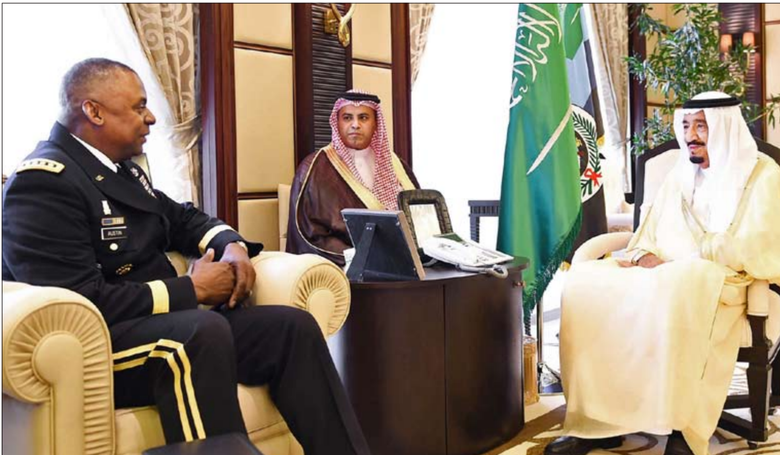
صاحب السمو الملكي الأمير سلمان بن عبدالعزيز ولي العهد نائب رئيس مجلس الوزراء وزير الدفاع السعودي مستقبلاً قائد القيادة المركزية الأميركية الفريق أول لويدي جيه أوستن