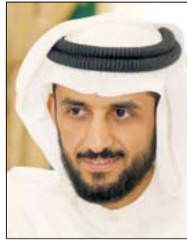
م. حجر الحجر