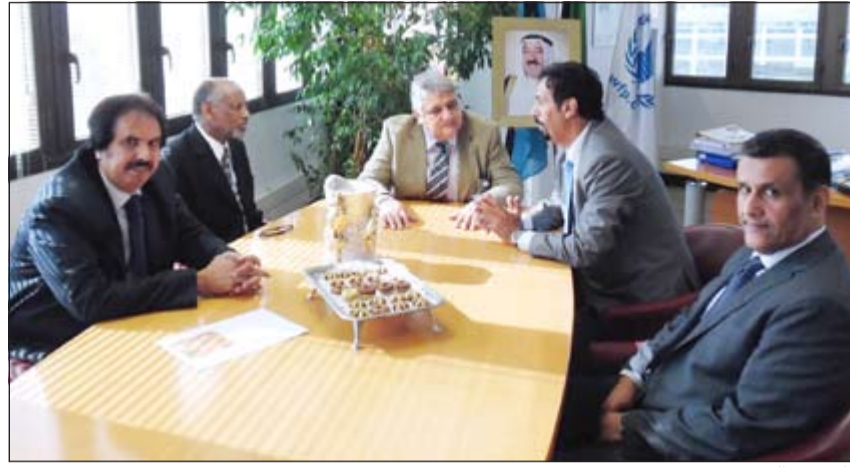
جانب من الحفل

ولفت الى ان «هذه الخصال الحميدة قد تحولت الى جزء من الجيولوجيا الكويتية وسياساتها الخارجية ولا تقتصر على المحيط العربي الاسلامي بل تجاوزت ذلك لتشمل خدمة الإنسانية اينما تواجه مشكلات طارئة او ملحة فكانت الكويت بعد الاستقلال مباشرة اول دولة في المنطقة