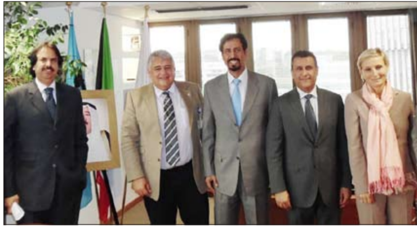
ممثلو برنامج «الأغذية العالمي» مع اركان السفارة