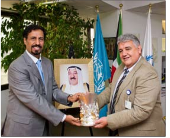
السفير الشيخ علي الخالد يتبادل الدروع مع ممثل برنامج الأغذية

وشدد سفير الكويت في هذا الصدد على ان الدور الريادي المشهود الذي استحق عليه سمو الامير حفظه الله ورعاه هذا اللقب العالمي الكبير عزز من مكانة الكويت المرموقة في الاوساط الدولية بشكل يلمسه شخصا مثل جميع ممثلي الدبلوماسية الكويتية لدى دول العالم ومؤسساته التعاون والشراكة الواسعة مع