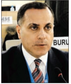
السفير جمال الغنيمة

وشكر السفير الشيخ علي الخالد في كلمة القاها برنامج الأغذية العالمي باعتباره اكبر وانشط وكالات الامم المتحدة وذراعها في الحقل الإنساني على دعمه القوي لترشيح سمو الامير «قائد للعمل الإنساني» في العالم واعتماد الكويت «مركزا للعمل الإنساني»