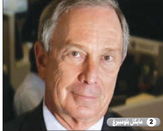
2 مايكل بلومبيرغ

من الداعمين لمشكلة تغير المناخ ويسعى جامداً لزيادة المعرفة حول تغيرات المناخ العالمية.