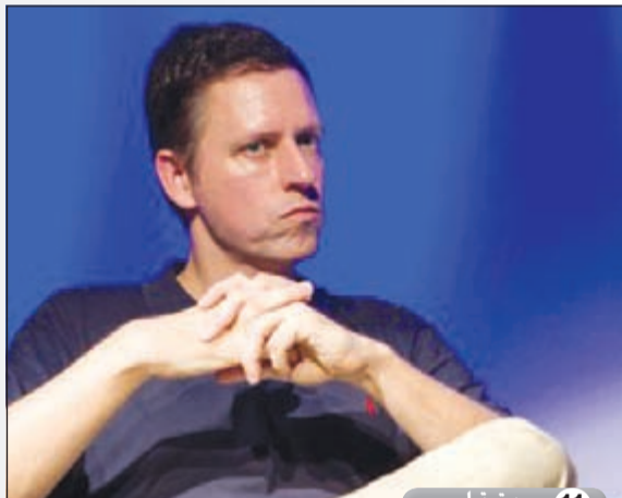
11 بيتر ثيل

رجل أعمال ومبرمج أمريكي اشتهر بتأسيسه موقع الفيسبوك الاجتماعي. وهو أكبر موقع اجتماعي في العالم. ويعمل زوكربيرغ إلى جانب منظمة 'FWD.us' لإصلاح قوانين الهجرة كما دفع مؤخراً بإصلاح المدارس في مدينة نيويورك بولاية نيو جيرسي.