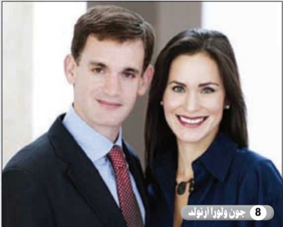
8 جون ولورا أرنولد

الأخوان كوش تبرعوا بـ30 مليون دولار لحملة دعائية للمرشحي الحزب الديمقراطي في عدد من الولايات الأمريكية. ولهم حملات دعائية ضد قانون برنامج أوباما للرعاية الصحية 'أوباما كير'.