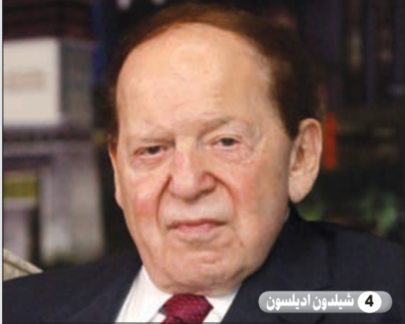
4 شيلدون ادلسون

اتفق ادلسون نحو 93 مليوناً من أجل إحقاق الرئيس أوباما في انتخاباته الرئاسية فيما وعد بذلك بإنفاق ضعفي المبلغ من أجل هزيمته خلال الانتخابات المقبلة.