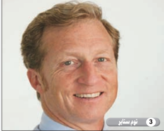
3 توم ستاير

اتفق ادلسون نحو 93 مليوناً من أجل إحقاق الرئيس أوباما في انتخاباته الرئاسية فيما وعد بذلك بإنفاق ضعفي المبلغ من أجل هزيمته خلال الانتخابات المقبلة.