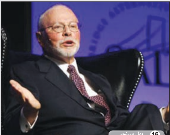
16 بول سينجر

من الداعمين للرئيس الأمريكي الحالي باراك أوباما وقد خدمت بوزارة التجارة الأمريكية خلال إدارته.