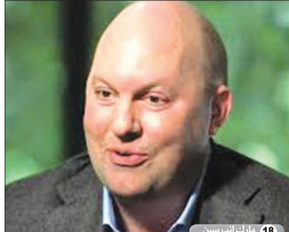
18 مارك أندرسون

جون دونالد جيه ترامب من مواليد 14 يونيو 1946 باميركا وهو رجل أعمال. وشخصية اجتماعية. وكاتب وشخصية تلفزيونية. وهو الرئيس والمدير التنفيذي لمؤسسة ترامب العقارية. شهدت أواخر التسعينيات تصاعداً في وضعه المالي وفي شهرته. وفي عام 2001. انتم بوج ترامب الدولي. الذي احتوى على 72 طابقاً ويقع هذا البرج السكني على الجانب الآخر من مقر الأمم المتحدة. كذلك بدأ البناء في 'ترامب بليس'. مبنى متعدد الخدمات على جانب نهر هدسون.