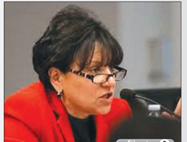
9 شيري ريدستون

من أكثر المؤيدين للرئيس الأمريكي الحالي باراك أوباما. كما أنه من أكثر الداعين لزيادة الضرائب على الأثرياء. ويعتبر بافيت من أغنى أغنياء العالم وأكبر اللاعبين في أسواق المال الأمريكية ويرأس شركة بيركنشاير أكبر شركة قابضة في العالم التي تحظى سعر سهمها 200 ألف دولار.