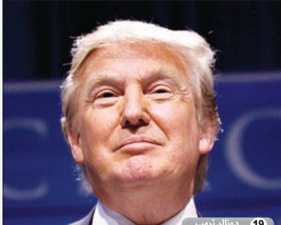
19 دونالد ترامب

الأمريكية آنيس والتون وهي أخت جون والتون المتوفي في حادث الطائرة. زوج أغنى سيدة في العالم. لكنها ورثت من أباها متحفاً لجسور الكريستال. وتملك النسبة الكبرى في أسواق وول مارت Wall mart الأمريكية. تبلغ ثروتها نحو 23 مليار دولار.