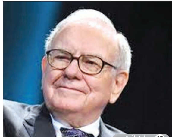
10 وارن بافيت

ساهم بنحو 2.6 مليون دولار بحملة سوبر PAC لرون نورث عام 2012. ولقد أعرب مؤخراً عن دعمه لزيادة الحد الأدنى للأجور.