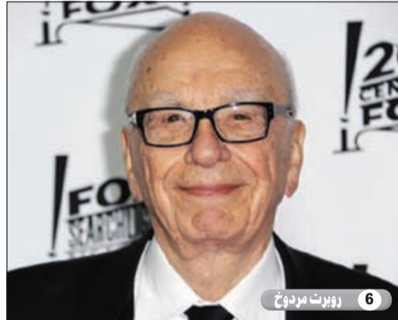
6 روبرت مردوخ

مؤسسة بيل وميلندا غيتس تأثير كبير في إصلاح التعليم إلى جانب مساهمتها بمبلغ 100 ألف دولار من أجل دعم زواج المثليين في استفتاء بولاية واشنطن.