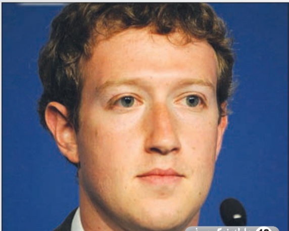
12 مارك زوكربيرغ

منح جورج سورس مليون دولار للرئيس الأمريكي باراك أوباما وهو أحد الممولين لحملة الانتخابية. ويعتبر سورس من أهم الشخصيات العالمية في عالم الاستثمار وإدارة صناديق التحوط وأكبر اللاعبين في البورصات والعصارات.