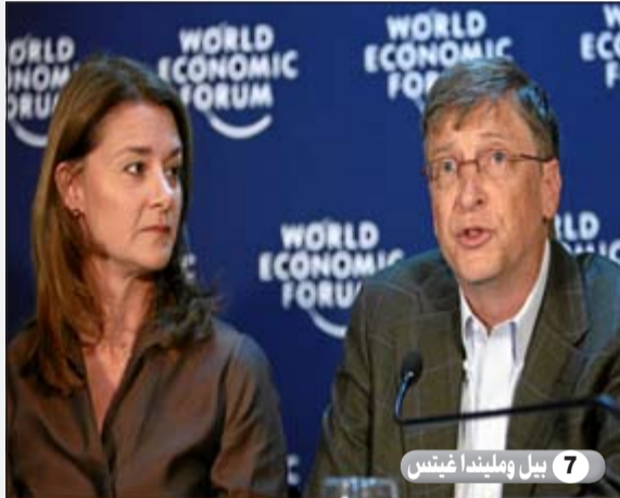
7 بيل وميلندا غيتس

اتفق الملايين من أجل صانعي القرار والمشرعين من أجل تحويل تكاليف الموظفين وتخفيض استحقاقات المعاش التقاعدي.