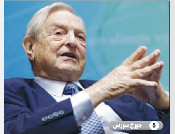
5 جورج سورس

هو رجل أعمال استرالي أمريكي يعتبر قطباً من قطب التجارة والإعلام الدولي وهو مؤسس ورئيس مجلس الإدارة والرئيس التنفيذي للشركة القابضة للإعلام الدولي نيوز كوربوريشن التابعة لها قناة فوكس نيوز الإخبارية. تعتبر شركة نيوز كوربوريشن ثاني أكبر تكتل لوسائل الإعلام في العالم. وهو يملك صحيفة ذي وول ستريت جورنال ويعمل إلى جانب بلومبيرغ لإعادة تأهيل قوانين الهجرة.