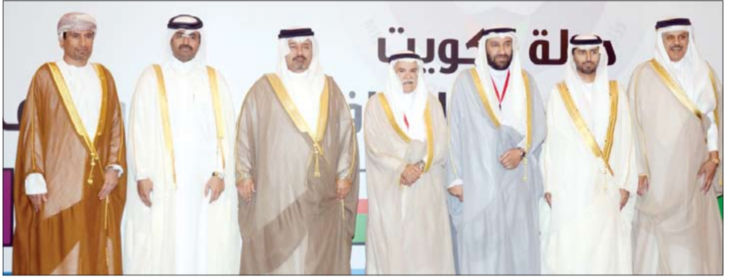
د. علي العمير مع وزراء النفط الخليجين خلال الاجتماع الـ 33 للجنة التعاون البترولي لوزراء دول مجلس التعاون

الذي تعانيه أسعار النفط حاليا «هبوط كبير» نتيجة كثرة الإنتاج والتطور الحاصل في الولايات المتحدة من حيث استخدام تقنيات جديدة لإنتاج النفط الصخري بالإضافة إلى الإمدادات النفطية من دول أخرى.