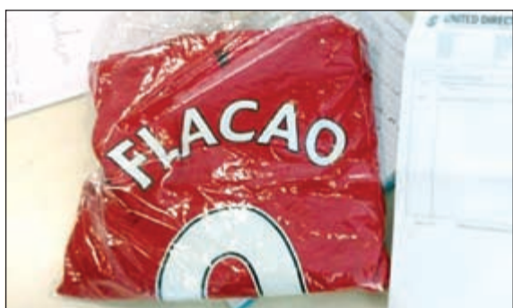
ما هذا يا يونانيد؟

مدريد السابق مطبوع بشكل خاطئ، وسخرت صحيفة «مترو» من هذا الخطأ الساخ الذي وقع فيه اليونانيد، وقالت إن مسؤولي الشياطين الحمر كانوا محظوظين للغاية، لعدم انضمام المهاجم الهولندي يان فينيجور أوف هيسيلتيك، الذي تعد حروف اسمه الأصعب بين لاعبي كرة القدم في العالم، حيث سبق أن لعب لأندية أبرزها هال سيتي الإنجليزي، سيلتيك، وأيندهوفن الهولندي