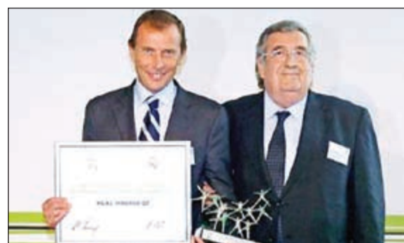
إيداع ريال مدريد في مختلف الجهات

على لقب «الليغا». وبعيدا عن الجانب الكروي، تسلم ريال مدريد في الحفل ذاته جائزة العمل الاجتماعي، وذلك نظير الخدمات التي قدمها للأطفال مساهما بـشكر القيم ومساعدة الأطفال المعرضين لخطر التهميش والاستبعاد عن العالم الاجتماعي بسبب الفقر وغيره من الظروف. هذا وقد حصد «الملك» العديد من الجوائز هذا العام حيث قدم صورة فنية وإنسانية جعلته يعتلي صدارة جميع أندية العالم.