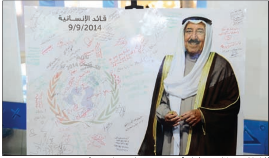
كلمات كثيرة دونتها الحضور على لوحة عبرت عن عمق مشاعرهم تجاه صاحب السمو