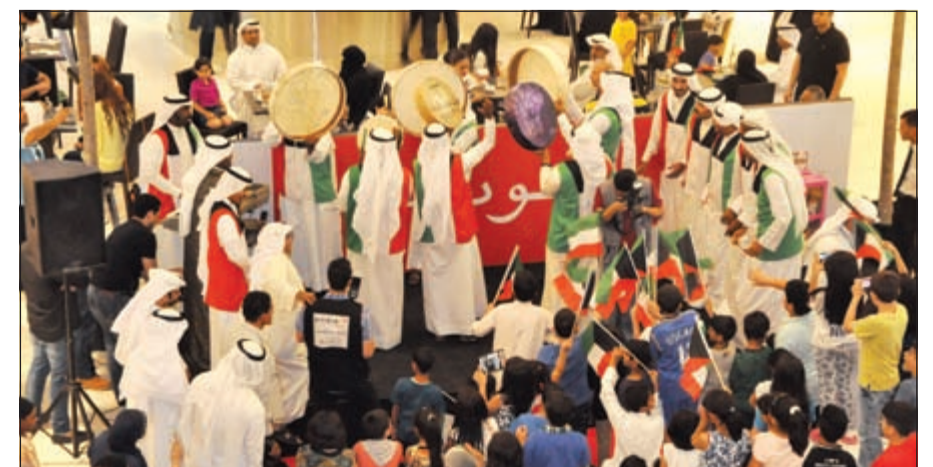
إحدى الفرق الموسيقية تحيي الاحتفال