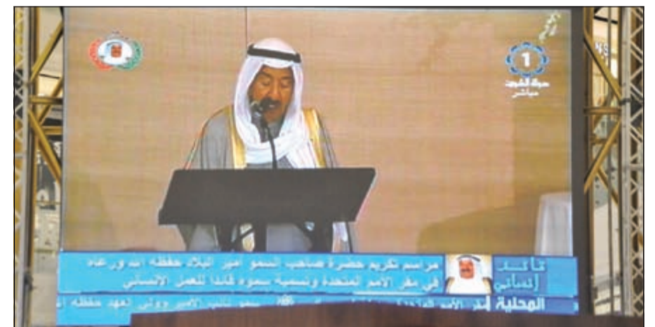
نقل مباشر لكلمة صاحب السمو من الأمم المتحدة

الهدايا الاستثنائية التي قامت إدارة «ذا جيت مول» بتوزيعها على الجمهور ابتهاجاً بتكريم صاحب السمو. بهذه المناسبة تقدم إدارة «ذا جيت مول» بالتبني والتبريكات إلى صاحب السمو الأمير والشعب الكويتي على هذا الإنجاز التاريخي والتكريم الاستثنائي من منظمة الأمم المتحدة.