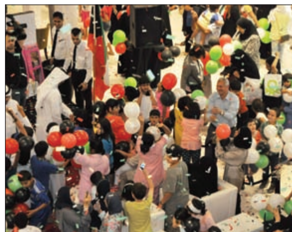
توزيع بالونات على الأطفال