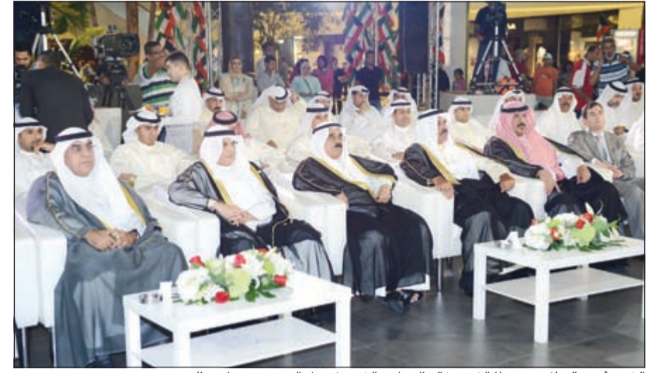
الشيخ أحمد النواف متوسطاً الشيخ خالد الجراح والشيخ فيصل السعود وعدداً من الحضور

أكد خلال احتفال محافظة حولي بالمناسبة أن العالم أجمع يشهد للكويت دعمها للمنظمات العالمية