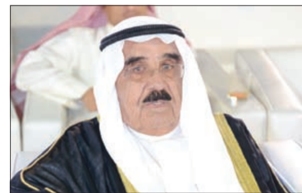
الشيخ فيصل السعود

أصبحت الكويت داعمة لكل الجهود الإنسانية الرامية للارتقاء بدول العالم على حد سواء. وأردف بقوله: اننا ومن خلال هذه المناسبة المباركة يطيب لنا أن نشير بأصابع الفخر إلى جهود سموه في دعم الوضع الإنساني الذي تعاني منه كثير من الشعوب المكوبة والذي تمخض عن تبني سموه لرعاية وعقد المؤتمرات العالمية والإقليمية التي تركز على إغاثة هذه الشعوب حتى تتجاوز محتنتها وتستقر أمورها. من جانبه، اعتبر مدير إدارة عالم المارينا راشد حمادة أن هذه الاحتفالية استثنائية تم العمل عليها لمدة أسبوعين