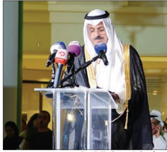
الشيخ أحمد النواف متحدثاً خلال الاحتفال