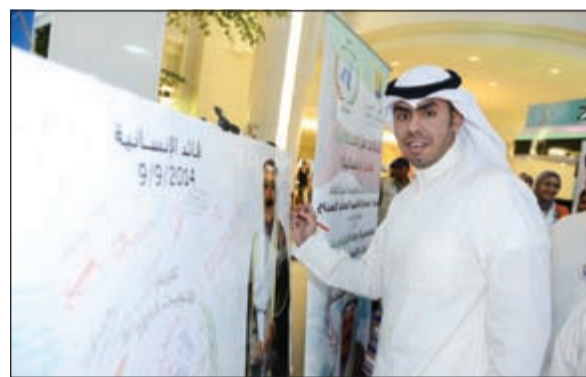
الشيخ نواف أحمد النواف يدون كلمة تذكارية لصاحب السمو

مضيفاً: نحن جزء منه ونفتخر بالدعم الإنساني الذي يقدمه سموه ودعمه المستمر للشعوب الفقيرة والمكوبين حول العالم وخاصة المنطقة العربية، متمنياً الدور الذي قدمه للشعب اللبناني خلال الأزمات التي تعرض لها لبنان، خاتماً حديثه بالقول: إدارة عالم المارينا فخورة بهذا القائد العظيم العم بوناصر قاندا الإنسانية. تخلل الحفل الذي نظمته محافظة حولي في مجمع المارينا مول أمس الأول بمناسبة تكريم وتسمية صاحب السمو الأمير قاندا إنسانياً، بعض الفقرات التراثية قدمت فرقة بلال الشامي، وفقرة شعرية قدمها الطفل ضاري الرشدان بكلمات شعرية خص بها صاحب السمو الأمير. حضر الحفل النائب عبدالله الطريجي والفريق إبراهيم الوسمي والشيخ منصور المبارك والشيخ جابر عبدالله الصباح والشيخ جابر الفيصل والشيخ فيصل السعود، وحرصت إدارة إطفاء محافظة حولي على التواجد بالحفل كما قامت إدارة العلاقات العامة بمحافظه حولي بتقديم الهدايا