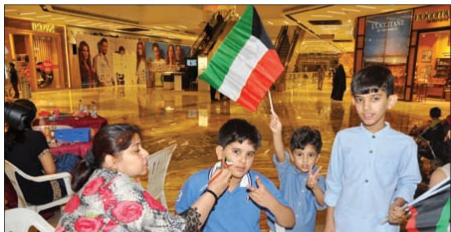
علم الكويت على وجوه الأطفال