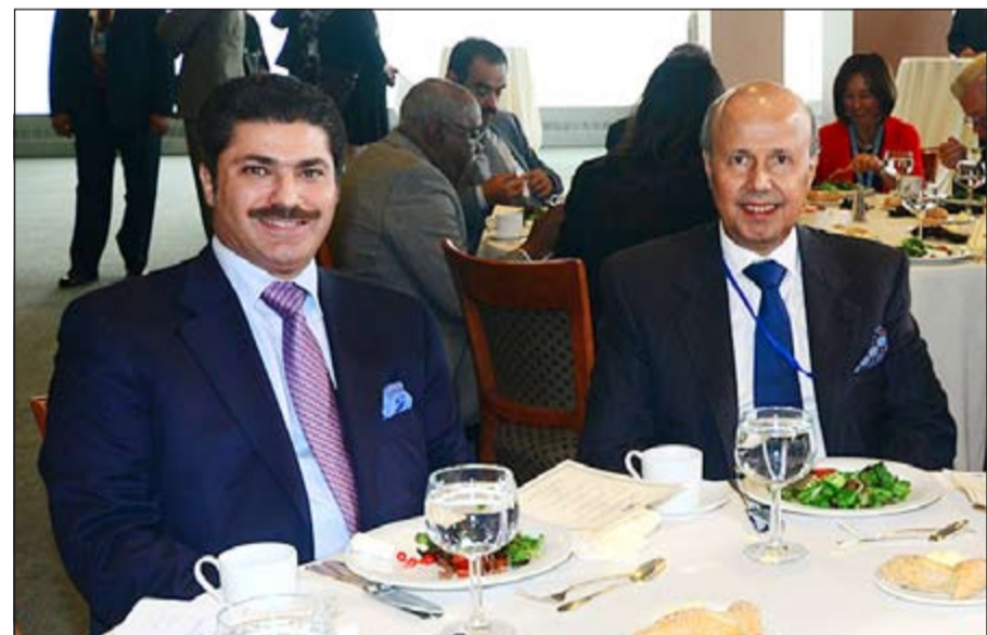
الشيخ خالد العبد الله والسفير أحمد فهد الفهد