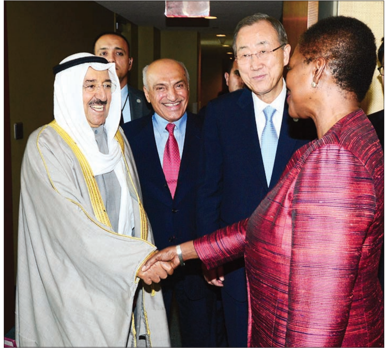
صاحب السمو الأمير مصافحاً فاليري أموس بحضور بان كي مون والمستشار محمد أبو الحسن