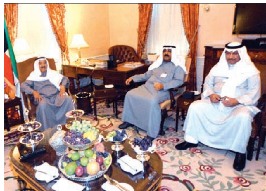
صاحب السمو الأمير الشيخ صباح الأحمد أثناء استقباله الشيخ مشعل الأحمد وسمو الشيخ جابر المبارك

استضافة الكويت لمؤتمرين لمساعدة الشعب السوري ساهما في جمع الملايين من الدولارات لمساعدة المحتاجين بعث رئيس مجلس الأمة مرزوق الغانم برسالة تهنئة إلى صاحب السمو الأمير الشيخ صباح الأحمد بمناسبة تكريم سموه من قبل الأمم المتحدة واختياره (قائداً للعمل الإنساني) وتسمية الكويت (مركزاً للعمل الإنساني). وقال الغانم في رسالته «يطيب لي أن أرفع إلى