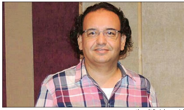
المخرج عادل التلمساني