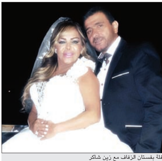
فلة بفستان الزفاف مع زين شاكر

على حسابها الشخصي بموقع التواصل الاجتماعي «فيسبوك»، نشرت المطربة الجزائرية فلة، صورة لها وهي ترتدي فستان الزفاف، وإلى جوارها المطرب زين شاكر، يرتدي بدلة أنيقة. وتصور «الفيسبوكيون» للوهلة الأولى أن فلة تزوجت، ودخلت القفص الذهبي أخيراً، رغم أن عمرها تخطى الخمسين عاماً، وهو ما دفعهم لتقديم التهاني والتبريكات، وتمني حياة سعيدة للعروسين، قبل أن تنهال الأسئلة الشخصية على فلة، بخصوص تعرفها إلى عريسها، ومتى وأين، وكيف انتهى بهما اللطاف للزواج.