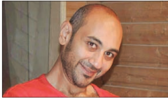
الملحن والموزع إسلام شكري