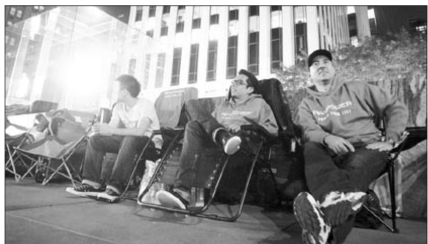
عشاق آيفون يفترضون الأرض أمس بانتظار الإعلان عن الإصدار السادس اليوم (رويترز)

وسوف تشتمل على برامج من شأنها أن تجعل الهاتف المحمول بمنزلة محفظة متنقلة، هذا بالإضافة إلى الأجهزة التي يمكن ارتداؤها والتي من المتوقع أن يكون بها خواص من شأنها مراقبة الصحة وأنشطة اللياقة البدنية.