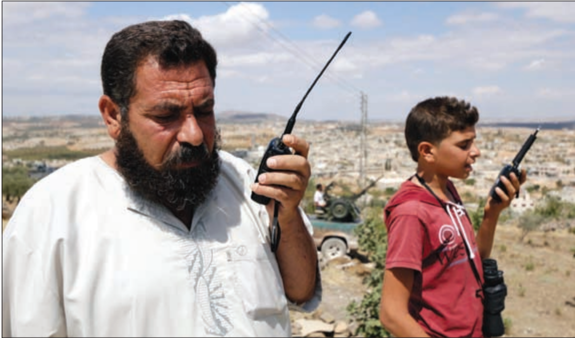
صبي سوري ووالده يراقبان مواقع القوات الموالية للرئيس السوري في ريف إلب امس الاول

والتي دخلت عامها الرابع. ولفتت عبدالعظيم إلى أن جهودها اقليمية وحقيقية وجديسة» تبذلها حاليا كل من إيران ومصر والجزائر وتركيا لإيجاد حل سياسي للارزمة وذلك بعد تعطل الجهود الدولية على خلفية الخلاف الذي نشب بين الولايات المتحدة وروسيا بسبب الازمة الاوكرانية. امنيا، ذكرت مصادر في المعارضة السورية أن الجيش السوري أرسل امس تعزيزات عسكرية تضم آليات وجنودا إلى قرية مسخرة في ريف القنيطرة، وذلك بعد يوم رسمي من قبل الحكومة في دمشق حول صحة هذه الأنباء في وقت لاتزال عمليات القصف والاشتباكات متواصلة في مناطق متفرقة من البلاد. وأضاف المرصد في بيان ان الاشتباكات بين قوات المعارضة والنظام نشبت اثر محاولة قوات الاخير السيطرة على منطقتي عين ترما وجرمانا اللتين تحصن بهما قوات المعارضة. وذكر ان قياديا في جبهة