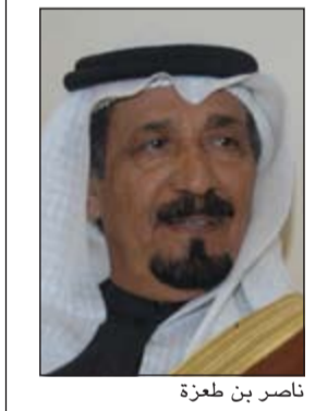
ناصر بن طعزة

القائد الذي عندما يمنح لا ينظر للجنس والدين والعرق، بل يمنح ويعطي من إنسانية بحتة لا ينتظر رداً على ذلك العطاء، فهنيئاً للكويت بهذا القائد العظيم الذي لا يالو جهداً في خدمتها، ورفع اسمها عالمياً في جميع المحافل الدولية، فلننا اليوم نعتز بهذا التكريم الذي هو تكريم لنا ونفخر به، فالقائد قائد الإنسانية والكويت مركز إنساني وإذا أردنا أن نعدد المواقف يعجز اللسان والكلمات عن ذكرها.