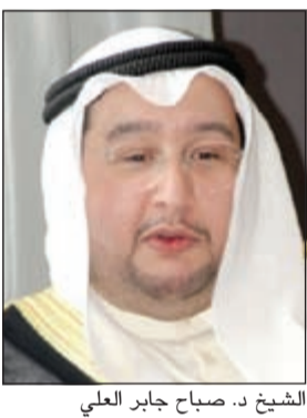
الشيخ د. صباح جابر العلي

البحرية لعمل استعراض مائي، رافعين الأعلام ومستخدمين مرشحات المياه مع إطلاق صافرات القطع البحرية وذلك بمشاركة أهل الكويت فرحتهم. من جانبه، قال مدير عام مؤسسة الموائى الشيخ د. صباح جابر العلي إن مشاركة المؤسسة شعب الكويت للاحتفال بهذه المناسبة تأتي إيماناً منها بأن هذا اليوم أصبح عيداً جديداً ينضم إلى أعياد الكويت التي لن ينسأها الشعب على مدار