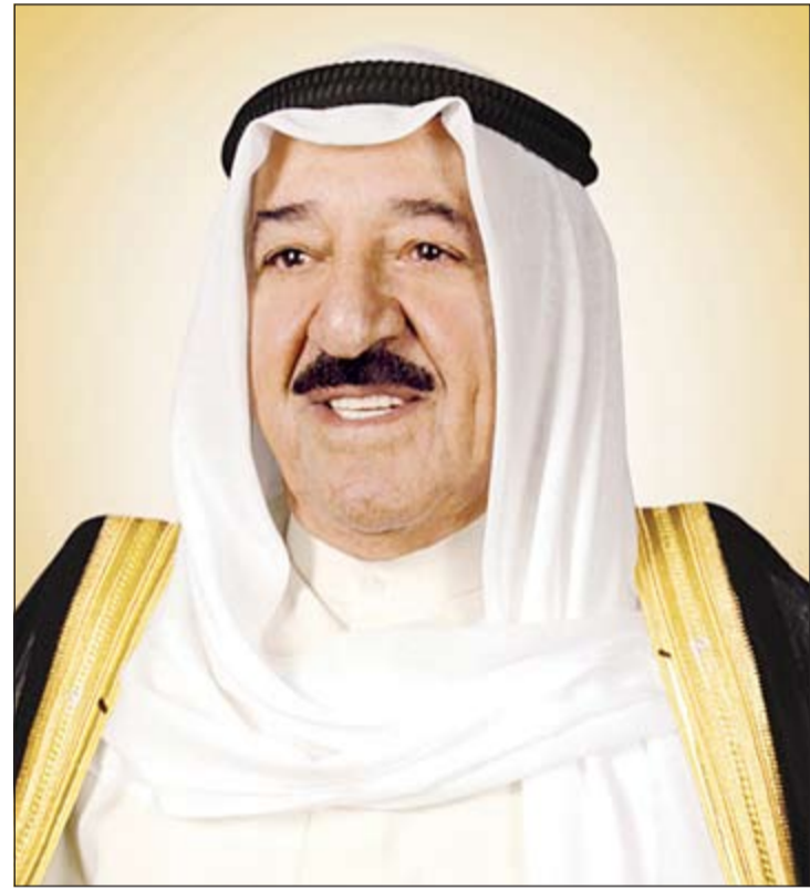
صاحب السمو الأمير الشيخ صباح الأحمد

التغييرات وتعزيز المسؤولية الاجتماعية للشركات العائلية، ومن أجل ذلك يستضيف الملتقى العديد من المتحدثين والشركات العالمية المتخصصة لمناقشة محاور الملتقى التي توزعت على النحو التالي: أ - التحديات المستمرة أمام الشركات العائلية: وهذا المحور يناقش المواضيع المتعلقة