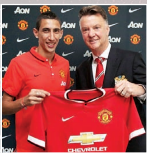
دي ماريا مع المدرب فان غال

النادي على العقد منذ عام 2012 ليكون أعلى رقم في العالم، ويحصل بموجب على أكثر من ضعف المادي السابق. كما يتفاوض النادي في الوقت الحالي من أجل التعاقد مع الراعي السابق ليظهر على قميص التدريب مقابل 17 مليوناً سنوياً، ليظهر أيضاً داخل ملعب كارينغتون الخاص بتدريبات الفريق.