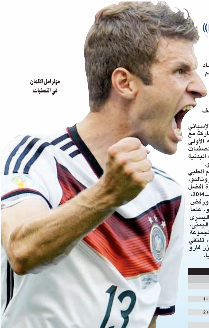
مولر امل الألمان في التصفيات

أعلن نادي كوبريتارو المكسيكي أنه تعاقد لمدة عامين مع البرازيلي رونالدنيو أفضل لاعب في العالم مرتين والفائز مع منتخب بلاده بلقب كأس العالم 2002. وأصبح رونالدنيو (34 عاما) لاعبا حرا في يوليو الماضي بعد فسخ عقده بالتراضي مع أتليتيكو مينيرو البرازيلي. وقال النادي المكسيكي في بيان «نحن سعداء جدا بأن نضيف إلى فريقنا لاعبا يملك سجلا دوليا حافلا وفاز بجائزة أفضل لاعب في العالم عامي 2004 و2005». وأضاف «نتمنى أن تشارك جماهير مدينتنا في الاحتفال بانتقال رونالدنيو إلى الفريق».