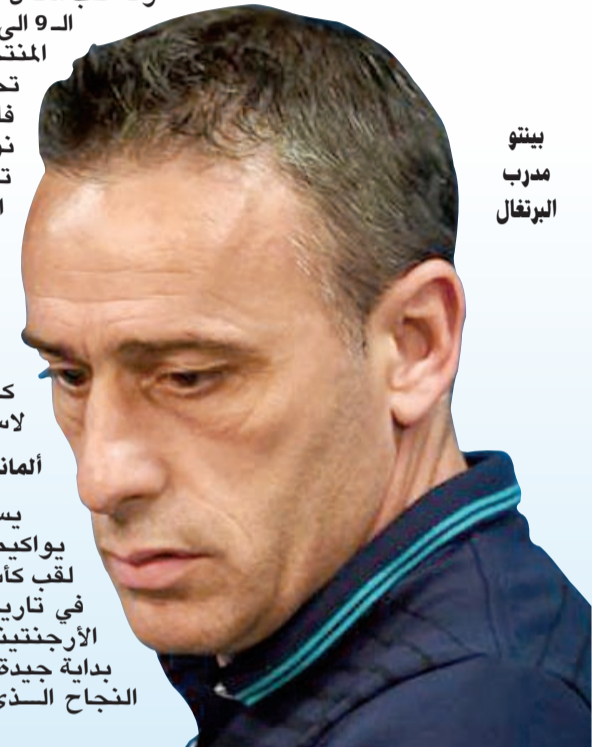
بنتو مدرب البرتغال

يبدأ منتخب ألمانيا بطل العالم مشواره في التصفيات المؤهلة إلى كأس أوروبا لكرة القدم المقررة في فرنسا عام 2016 عندما يستضيف اسكتلندا ضمن الجولة الأولى من منافسات المجموعة الرابعة. وتقام الجولة الأولى على مدار 3 أيام حتى الثلاثاء المقبل، على أن يبدأ منتخب إسبانيا بطل النسختين الماضيتين حملة الدفاع عن لقبه غدا