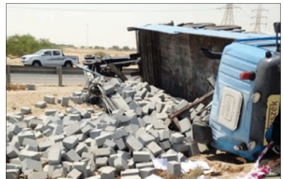
شاحنة الطابوق بعد الحادث

عمليات الداخلية عن وقوع حادث تصادم صباح أمس فتوجه على الفور رجال الإطفاء ورجال الإسعاف فتبين أن قائد المركبة قد توفي ووقع وقوع الحادث جراء قوة التصادم الذي تسبب بانقلاب الشاحنة الصغيرة المحملة بالطابوق فتم سحب المركبات ونقل الجثة إلى الطب الشرعي.