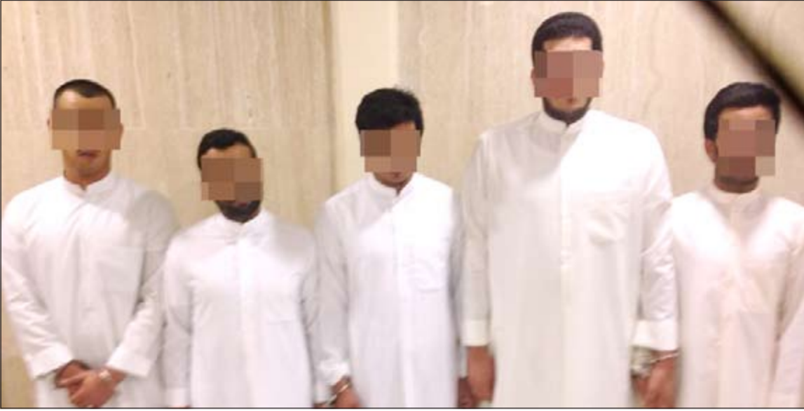
المتهمون الخمسة في صورة وزعتها «الداخلية»، أمس

الجهود مستمرة لملاحقة وضبط باقي المتهمين تمهيدا لضبطهم جميعا وإحالتهم إلى جهات الاختصاص. وقد أدلى المتهمون المقبوض عليهم باعترافات تفصيلية عن واقعة الاعتداء على الضابط ومرافقه وإصابتهما بإصابات بالغة بإتلافات وأضرار جسيمة. وقد أقرت جهات التحقيق في هذا الاعتداء المشين.