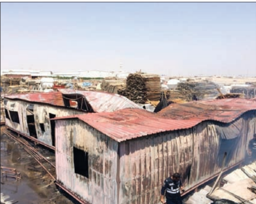
منظر عام للشاليهات بعد الحريق

تكون التقود التي أفاد الوافد بأنه يخبئها قد نجت من الحريق. وأضاف المصدر: قمنا بعمليات تبريد واسعة حول الشاليه الخاص بالوافد وبخنتنا معه غرفته وكانت المفاجأة أن النيران لم تمس النقود وتم إخراجها كاملة كما هي، وكذلك إخراج كمية من الذهب الخاص بالوافد. وعلق المصدر قائلاً: «لا نعلم ولكن يبدو أن الإيراني محظوظ جدا إن تنجو نقوده كلها من الحريق بطريقة أثارت استغرابنا..»