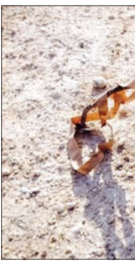
صور لهجاز التنصت الاسرائيلي الذي تم تفجيره في بلدة عدلون جنوب لبنان

رئيس الحكومة تمام سلام قال ان حكومته تعمل على تحرير العسكريين المختطفين، لكن ليس الي درجة اللهاث وراء الارهابيين، وقال: نحن ايضا نملك أوراق قوة للتفاوض، لكن المطلوب من الاهالي مساعدتنا لا التهجم علينا، فنحن في معركة مفتوحة مع الارهاب الذي يمكن ان يقوم بأي عمل ولا شيء