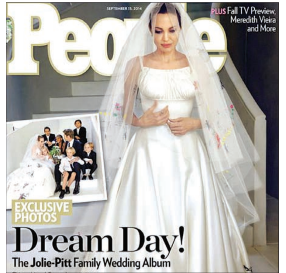
جولي بفسستان الزفاف على غلاف المجلة

كاليفورنيا - إيلاف: كشفت نجمة هوليوود أنجلينا جولي في مقابلتها الحصرية مع مجلة بيبول الغنية الأميركية - حول زفافها المفاجئ من النجم براد بيت في فرنسا، بعد ارتباط دام 9 سنوات - الطريقة التي اختارتها وزوجها لتكريم ذكرى والدتها الراحلة في مراسم الحفل الحميم والفرح الذي أقيم في عقارهما الفرنسي الخاص. وذكرت جولي في حديثها للمجلة أن التكريم الذي أعده بيت لوالدتها كان محفورا داخل الكنيسة حيث وقفا بتبادلان عهد الزفاف، وقالت: «وقفنا على صخرة حفر عليها إهداء لروحها». ولم تكتف جولي الأم البالغة من العمر 39 عاماً، بهذا التكريم لوالدتها في يوم زفافها، لكنها وشقيقها اتفقا على ارتداء بعض مجوهرات