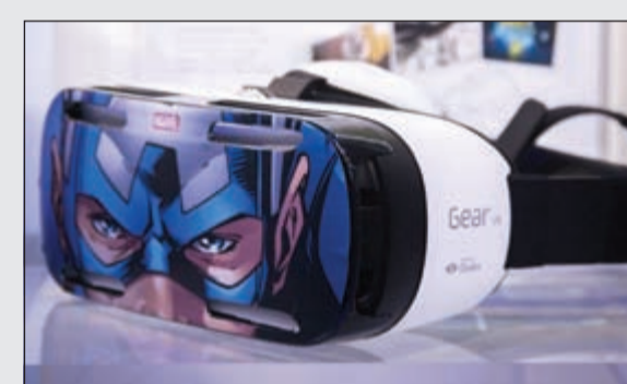
نظارة الواقع الافتراضي

بدقة QUAD HD. وأوضحت سامسونج أن الهاتف جالاكسي نوت إيدج، يملك المواصفات التقنية والمزايا الجديدة الخاصة بالهاتف جالاكسي نوت 4، وهو الهاتف اللوحي