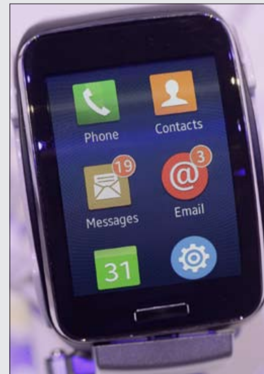
ساعة نكية جديدة بشاشة منحنية لمسية وتعمل بنظام التشغيل تايزن

الذي كشفت عنه الشركة خلال المؤتمر ذاته، عدا البطارية.