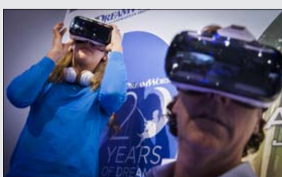
جانب من تجربة نظارة الواقع الافتراضي

وأطلقت سامسونج أيضاً ساعة نكية جديدة بشاشة منحنية لمسية وتعمل بنظام التشغيل تايزن، تتميز الساعة بأنها تقبل بطاقة سيم وبالتالي يمكن استخدامها لاستقبال المكالمات والاتصال بالانترنت من دون الحاجة لربطها بهاتف نكي، وللحاجة الكثير من الخصائص البرمجية مثل إمكانية تلقي الأوامر الصوتية والتتبع عبر GPS ويمكن ربطها مع 20 هاتفاً من أجهزة سامسونج كما أن الشركة تعاونت مع أكثر من ألف مطور لصنع تطبيقات مخصصة للساعة.