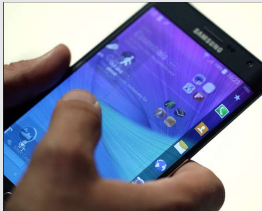
الهاتف اللوحي الجديد المزود بشاشة منحنية Galaxy Note Edge