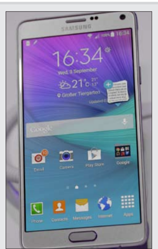
جالاكسي نوت 4 الجديد