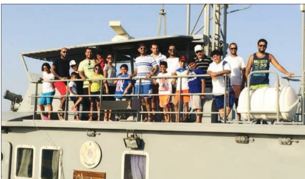
المشاركين في الرحلة

الإدارة العامة لخفر السواحل، وذلك يوم السبت الماضي، وقد أشاد جميع الحضور بحسن التنظيم والفعاليات خلال الرحلة. وقال المقدم شننير إن هذه الرحلة تأتي بناء