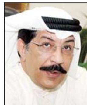
اللواء عبدالحمد العوضي

ضمن جهود قطاعات وزارة الداخلية لحفظ الأمن والأمان للمواطنين والمقيمين وتحقيق الاستقرار في المجتمع ومحاربة الجريمة بشتى أنواعها نفذت مديرية أمن محافظة حولي حملة أمنية مرورية وقدمت مساعدات إنسانية للمواطنين والمقيمين. صرح بذلك مدير عام مديرية أمن محافظة حولي بالإنابة العميد عبدالله حمد عبدالله العجمي، مشيراً إلى أن