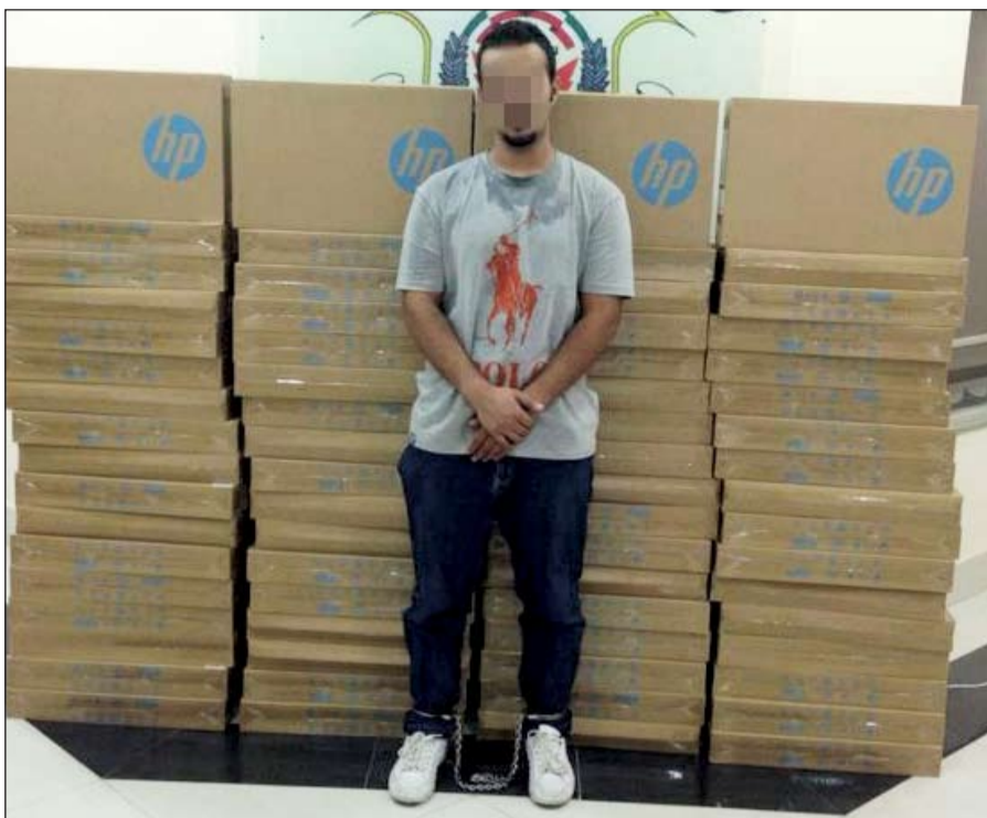
المتهم وتبدو خلفه أجهزة اللابتوب التي تمكن رجال المباحث من استعادتها

يجري رجال الإدارة العامة للرقابة والتفتيش تحقيقاً موسعاً حول حصول ضابط مخفر على بدل حجز لمدة طويلة رغم أنه خلال تلك الفترة كان يتمتع بإجازة طبية. وفي التفاصيل كما يوردها مصدر أمني أن رجال الإدارة العامة للرقابة والتفتيش شرعوا في فتح تحقيق موسع حول كيفية حصول ضابط المخفر في محافظة الفروانية على بدل حجز لمدة 3 أشهر متصلة رغم أنه كان خلال تلك الفترة كان يتمتع بإجازة طبية. وقال المصدر إن القضية بالنسبة لرجال الرقابة والتفتيش تدخل في دائرة تبديد أموال عامة وتلاعب في الكشوفات، موضحاً أن رجال الرقابة والتفتيش وجدوا أن المسؤول الأعلى لضابط لم يقم بإرسال الطبيات التي تفيد بتمتعوه بإجازة طبية وهو الأمر الذي أدى إلى صرف بدل الحجز له كامل مدة ثلاثة أشهر.