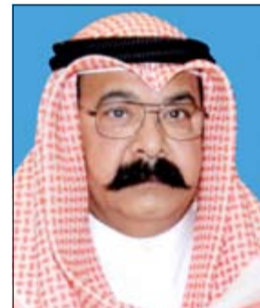
اللواء محمود الطباخ