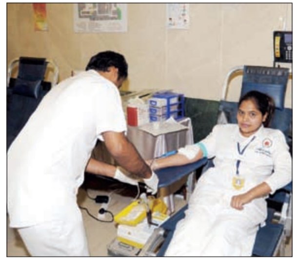
تبرع إحدى المرزات بالدم