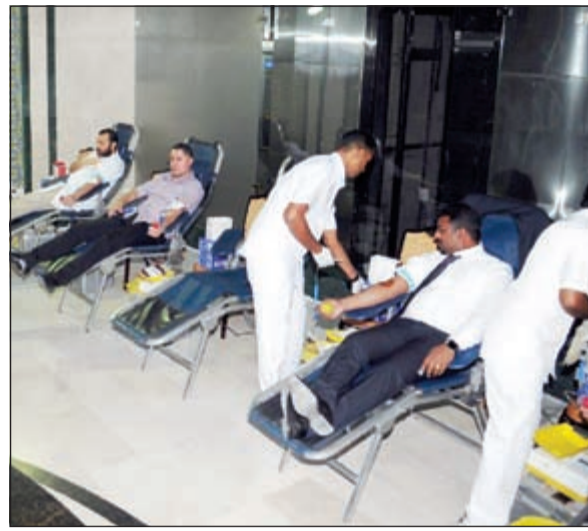
جانب من تبرع أسرة «دار الشفاء» بالدم

وقّعت وزارة الصحة عقد تصميم وإنشاء وتجهيز وصيانة مشروع توسعة مستشفى الفروانية الجديد بتكلفة مالية بلغت 265 مليون دينار. وذكر وزير الصحة د.علي العبيدي خلال توقيع عقد إنشاء مستشفى الفروانية الجديد مع شركة سيد حميد بيهاني وأولاده، أن سعة المستشفى السريرية تبلغ 955 سريرا، مشيراً إلى أن المستشفى يشمل كل التخصصات الطبية والطبية المساندة، وخدمات الأسنان، وغيرها من الخدمات الأخرى، كما يشمل مبنى متخصصاً للأسنان وخدمات الصحة المدرسية، وميناً أن مبنى الأسنان يضم 100 عيادة مختلفة، و30 أخرى لـ«الصحة المدرسية». وبين الوزير العبيدي أن مشروع مستشفى الفروانية الجديد يضم أيضاً مبنى لـ«العلاج الطبيعي»، ومبنى لـ«العلاجات الخارجية»، ويحتوي على 100 عيادة، يضم أيضاً 27 غرفة عمليات جديدة، و233 سريراً للعناية المركزة، مؤكداً أن التوسعة ستجني ثمارها لتوسيع الخدمات العلاجية في محافظة الفروانية لتغطية