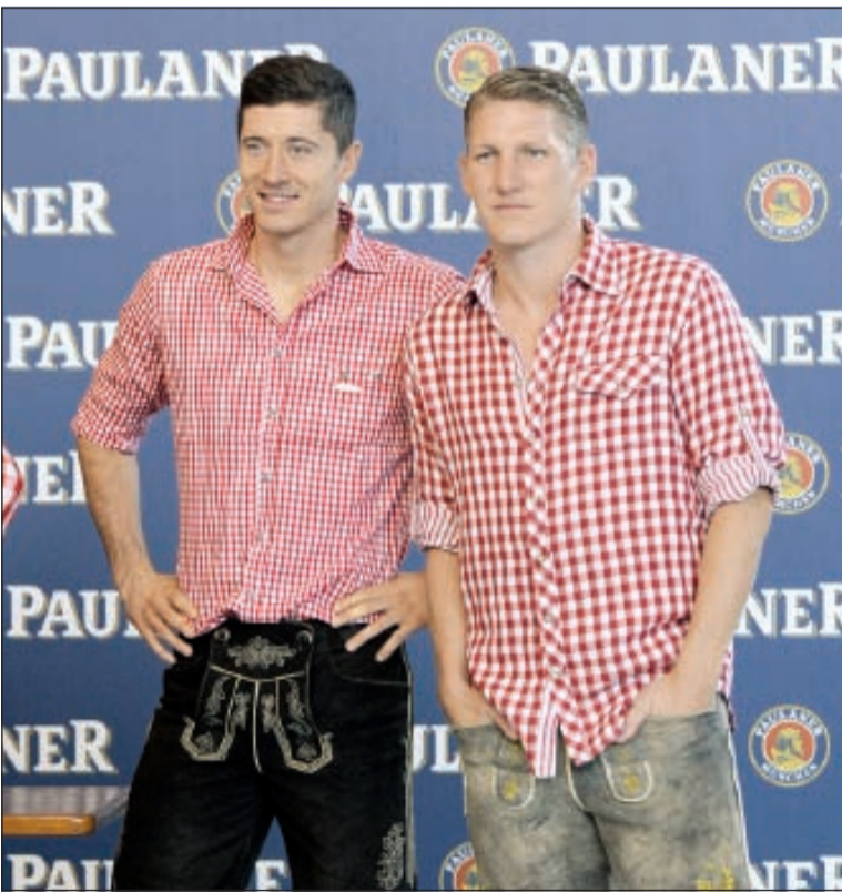
شفاينشتاينر ولغاندوفيسكي يظهران بالزي البافاري

بموروث المجتمع عدا قلة من أكلوا المنسف والمجوس والبريانسي. فهذه هي قيمة كرة القدم خصوصاً والرياضة عموماً تقرب الجعيد وتبعد المنغصت وتذل العقبات وترتبط الأسمر بالأبيض. وهذا الدلال مطلوب في ملاعبنا لأن انعكاسه سيكون إيجابياً على التعامل مع الجمهور أولاً والإدارة ثانياً والاتحاد ثالثاً ورابعاً وخامساً.. الخ، لأنهم باتوا «معازيب» وليسوا ضيوفاً فقط.. ونسال أحياناً من هو المحترف الفلاني أو العلاني في نادي ما حتى لو كان «سوبر»، لأنه لا أحد سيرفقه لو رآه في السوق أو في مجمع تجاري ما. وكما قال بلاتر: «نستطيع بكرة القدم ان ننظم كأس العالم في الكواكب».