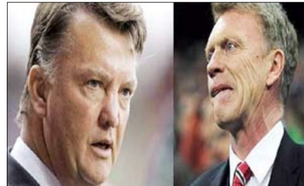
اين السير اليكس؟

ودفع الأموال الطائلة من أجل انتداب اللاعبين الكبار. كما ان المنافس التاريخي عاد ليكون هو الأقوى: بعد أن أزاح السير ليربول من على القمة لسنوات طويلة عاد الريذ في أماكنهم من جديد وهذه مشكلة كبيرة لليونائتد. وليس ذلك فحسب، بل ان منافس المدينة أصبح له اليد العليا، فمان سيتي أصبح يفوز بمعظم التدريبات في المواسم