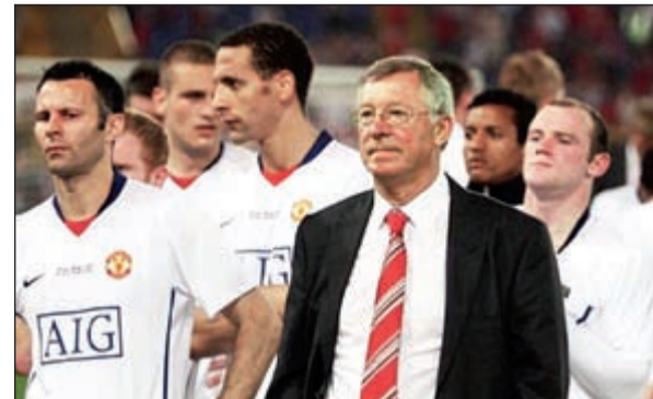
جيل كبير ذهب بلا رجعة

من عدم وجود لاعب محنك في وسط الملعب، فكاريك أو فليتشر قضاوا مواسم طويلة في وسط ملعب المانيو لكن ليسوا بقيمة روي كين الذي يحتاج الفريق ملخه في هذا المكان بشدة. وأكبر مشكلة يعاني منها «الشياطين الحمر» هي أن الأكاديمية لم تعد تعمل، فويليك وكليفرتي وإيفانز أبناء الأكاديمية الآن ليسوا على مستوى من سبقهم من فريق الأخيرة. وإذا كان السير قد ذهب فأيضاً دافيد غيسل قد رحل وكان مهندس الصفقات بالنسبة لليونائتد قوسياً للغاية في مركزه هذا الأمر لم ينطبق على وودوارد. واستمرت المعاناة برحيل القائد سوسو كان إيفرا أو فديتش أو ريو أو حتى اعتزال غيفز. ويعاني الفريق العريق أيضاً