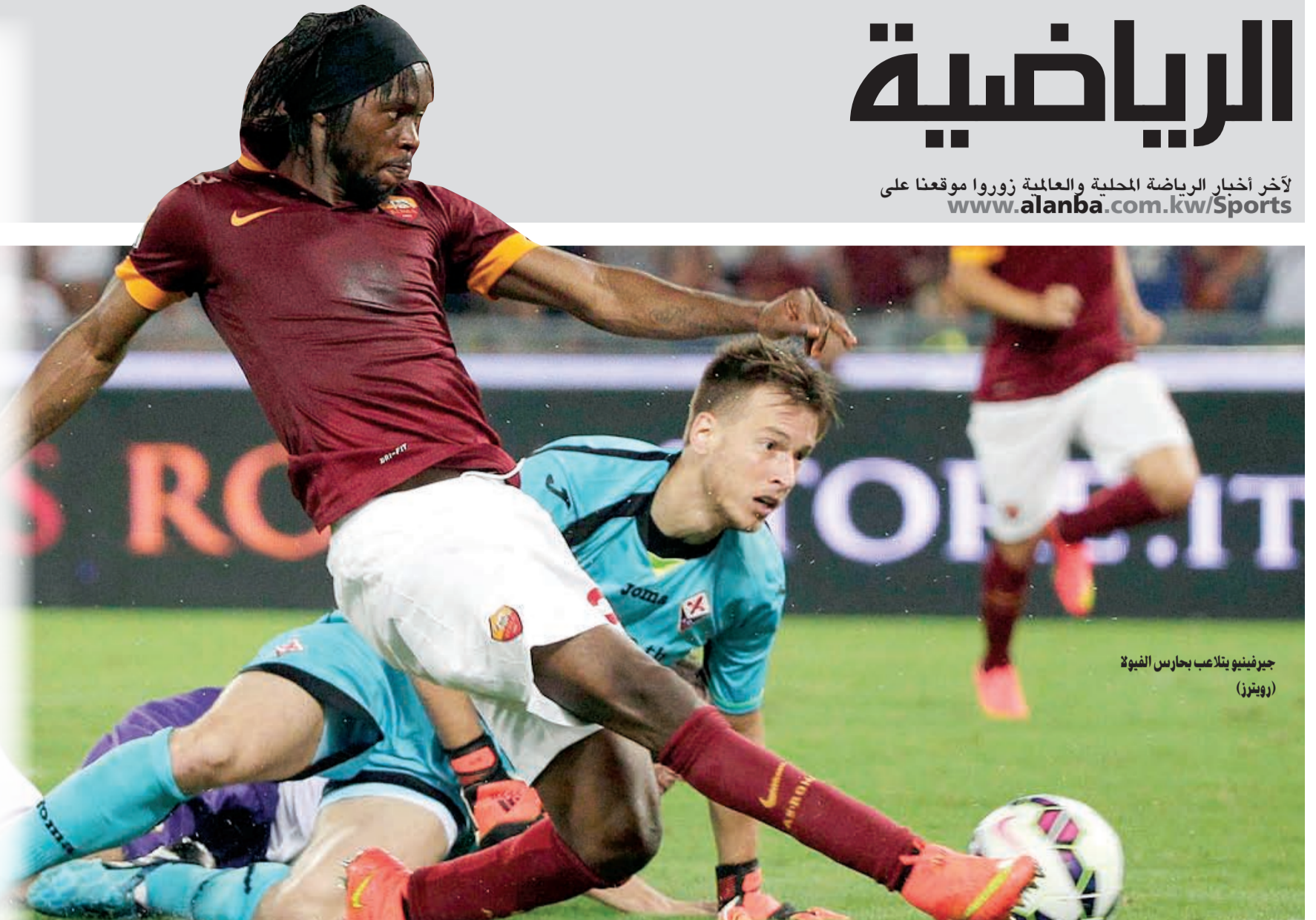
جيرفينيو يتلاعب بحارس الفيفا

أعرب دييغو سيميوني المدير الفني لأتليتيكو مدريد عن رضاه التام بالفوز الذي حققه فريقه على فريق إيبار الصاعد إلى الليغا وذلك بغض النظر عن الأداء. وقال سيميوني في تصريحات لصحيفة «أس» الإسبانية: نحن في بداية الموسم ومن الطبيعي أن يكون الأداء ضعيفاً بعض الشيء ولكننا حصدنا النقاط الثلاث في النهاية. وأضاف سيميوني: نحتاج إلى مزيد من العمل والتحسين داخل صفوف الفريق في الفترة القادمة. وعن احتمالية رحيل أو ضم لاعبين قبل غلق باب الانتقالات الصيفي، أوضح سيميوني أنه لم تتضح الأمور حتى الآن وأن هناك وقتاً.