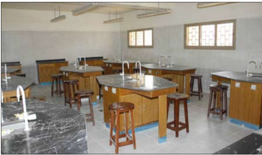
أحد معالم المدرسة

وأضافت ان مدارس منطقة سعد العبدالله تعاني من كثافة طلابية وذلك لوجود كثافة سكانية عالية في منازلها، مشيرة الى ان الوزارة تعمل على تدارك هذه المشكلة من خلال الفصول الإنشائية إضافة الى بحث إمكانية بناء مدارس جديدة في المساحات الشاغرة بعد التنسيق مع الجهات الحكومية ذات العلاقة. وأوضحت ان عدد المعلمين يبلغ 9 آلاف و943 معلماً ومعلمة في المراحل التعليمية المختلفة، لافتة الى انتظام 91 معلماً ومعلمة جداً في الدورات التدريبية والتي تنظم في مركز التدريب.