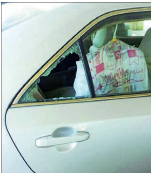
سيارة موظفة في «الصحة» سرقت محتوياتها في مواقف الوزارة

الفتح، لافتاً إلى أنه حينما قام بالإبلاغ عن سرقتها، قال له أحد أفراد الأمن «سنعمم بموصافاتها وأنت وحظك إما أن نعتز عليها أو يكون للصوص سبقونا وقطعناها وباعوها سكراباً أو هربوها خارج البلاد بعد مسح رقم الشاصي. وأوضح المواطن أنه ظل يبحث عن سيارته بنفسه