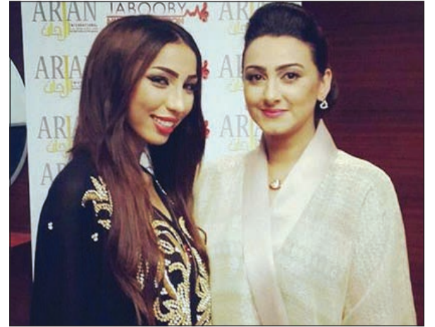
هيفاء حسين مع دنيا بطمة في كواليس الحفل

وكانت مفاجأة الحفل حضور الفنانة البحرينية هيفاء حسين التي حرصت نجمة «أراب آيدول» على شكرها على حضورها الحفل، ونشرت صورة تجمعها بها، وكتبت: «عاشوووو.. كان الحفل رائعاً جداً شكراً لكل المقيمين على نجاح هذا المهرجان وجمهور صلالة الرائع وجمهور مغربي الحبيب بللي كانوا متواجدين بالحفل، والفنانة الرائعة والخلوقة «هيفاء حسين» التي جاءت خصيصاً لحضور الحفل وسماع صوتي ومثل ما هي تحب صوتي أنا أموت فيها».