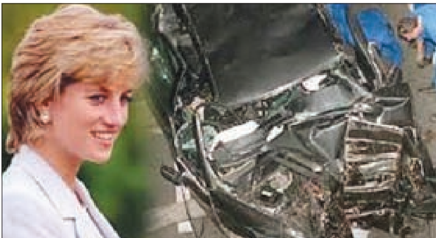
صورة أرشيفية لحادث الأميرة ديانا

مع ذلك لم أصدق قط انها ستموت». وعلم بوردون أن محاولات إنقاذ الأميرة باءت بالفشل عندما خرج الجراح من غرفة العمليات قائلاً إن قلبها توقف، ولم يتمكن الأطباء من إعادة نبضه، حينذاك طلب منه أن يحرس المشرحة حيث سجي جثمانها، «مغطى بشرشف أبيض وخصلات من شعرها الأشقر على الوسادة». يضيف بوردون في كتابه: «بقيت بجانبها ربع ساعة، كانت لحظة مؤلمة بشدة». ويتابع ضابط الشرطة الفرنسي السابق، الذي تقلت زوجته في حادث سير أيضاً: «كان وجه الأميرة رائعاً كأنها نائمة، كلمتها، قلت لها إنني أرى أنها لاقت مصيراً مفاجئاً، يا لها من خسارة».