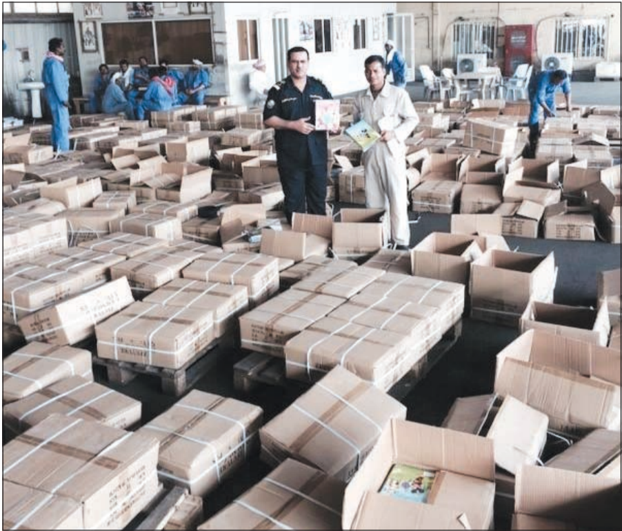
كميات ضخمة من البضاعة المقلدة تم استخراجها من الحاويات الأربع