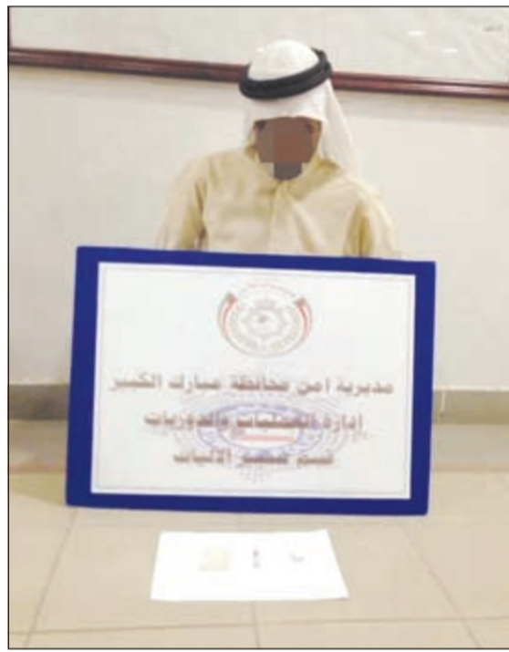
التمهم في مديرية امن محافظة مبارك الكبير