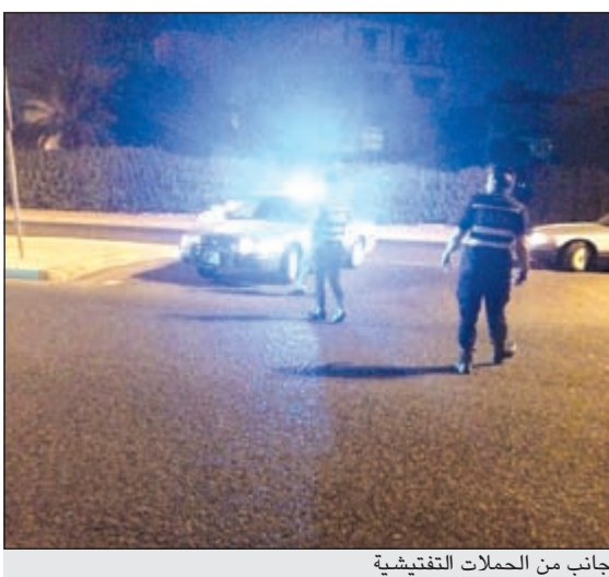
جانب من الحملات التفتيشية

تقدم وافد من الجنسية السورية ببلاغ الى رجال الامن بعد تعرض مركبته للكسر والاستيلاء على مبلغ 100 دينار وتم تسجيل قضية تحت مسمى السرقة عن طريق تحطم حرن.