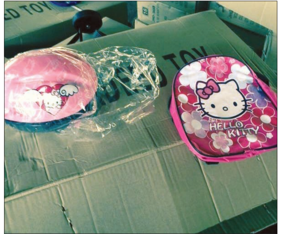
نماذج من البضاعة المقلدة

وفي كل عام يتم ضبط هذا النوع من الضبطيات، وأن عين رجال الجمارك لا تنام وهي التي تحرس البلد من الأشخاص المزورين.