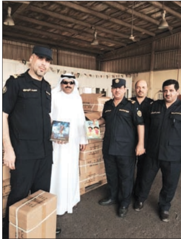
رجال الجمارك المشاركون في فرز البضاعة