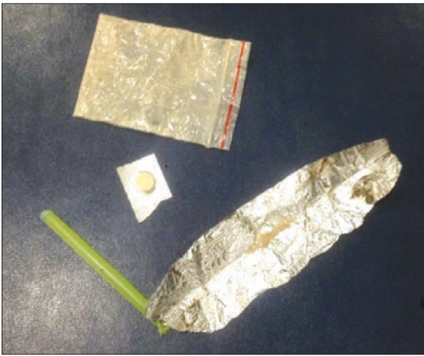
كمية المخدرات المضبوطة بحوزته