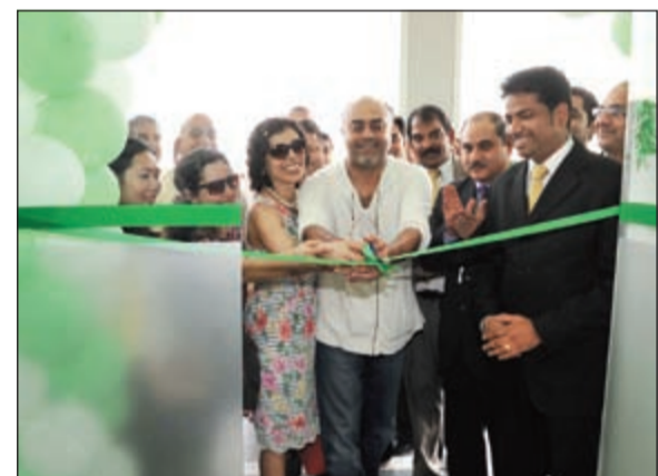
الممثل الهندي راجيت كابور يقص شريط الافتتاح ويبدو راجيش جيرولا

4 مليارات دولار. من جانب آخر، قال الممثل الهندي راجيت كابور: «هذه الزيارة الثالثة لنا للكويت وقد جئنا برعاية من شركة الملا العالمية للصيرفة، وكنت هنا منذ سنتين وقد قمنا بعمل عرض في المدرسة الأميركية وسقوم بعمل عرض للمدرسة أيضا في هذا الوقت.»