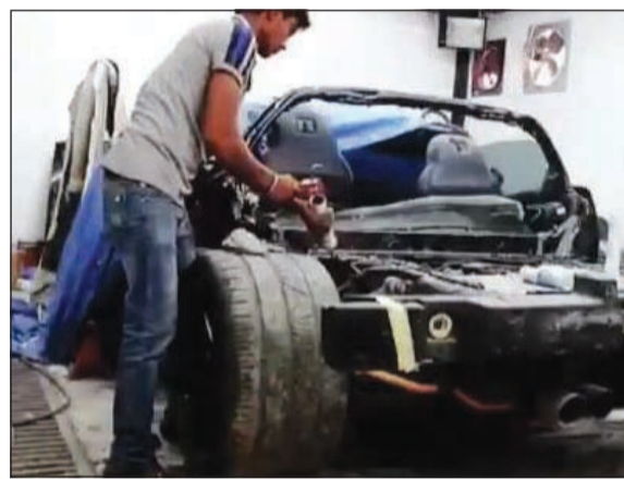
جانب من عملية التصليح