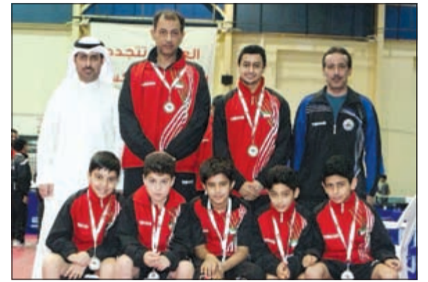
لاعب البراعم مع كأس المركز الثاني

بعد مباراة قوية ومتكافئة من الطرفين خسر منتخبنا لكرة الطاولة فئة البراعم نهائي البطولة العربية 24 والتي