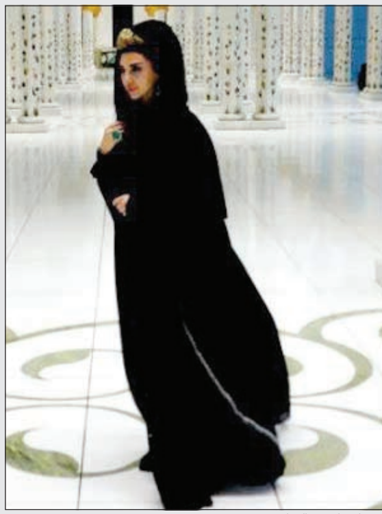
ميريام فارس بالعباءة