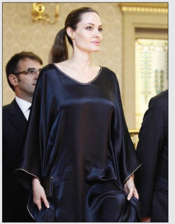
.. وانجلينا جولي