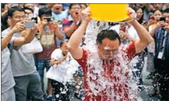
أحد المشاركين في تحدي دلو الثلج

وأوضح منظمو تلك التظاهرة أن اعتراضهم على هذا التحدي هو كونه يشكل دعوة إلى إهدار كميات كبيرة من المياه، في وقت يجب المحافظة فيه بجدية على كل نقطة ماء. وفي محاولة من جانبيهم لتوصيل رسالتهم، ارتدى منظمو تلك التظاهرة الاحتجاجية في مدينة شننتش في مقاطعة قوانغدونغ ملابس خاصة بالسباحة للتشجيع على توفير المياه. بعد ظهورهم بملابس السباحة، وقف المشاركون