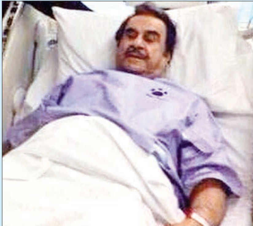
بوعدنان في المستشفى البريطاني

كبيرة من الفنانين منهم: أحمد السلطان، حسن البلام، إلهام الفضالة، هيا الشعبي، ميس كمر، جمال الردهان، أحمد العونان وآخرون.