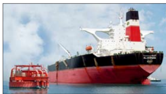
إحدى ناقلات شركة ناقلات النفط الكويتية